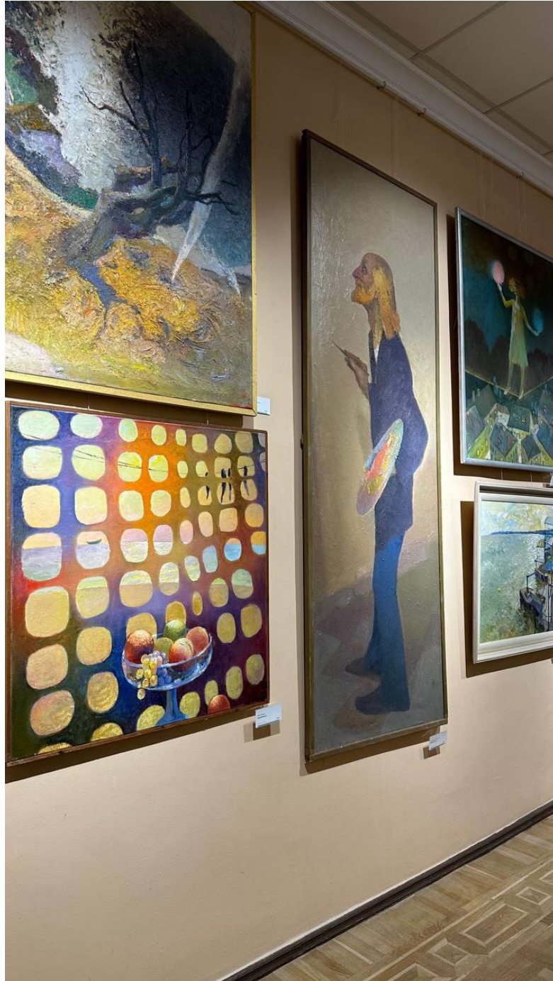
Експозиції у другій залі

Поки дівчина робила мені каву, вони обговорювали дещо досить буденне, як би страшно це не звучало – обстріли. Хлопець скаржився, що кожної ночі прокидається від гучних звуків, потім не може заснути, але на роботу треба йти. Дівчина з ним погоджується й каже, що вже за сьогодні випила три чашки кави, аби не заснути.