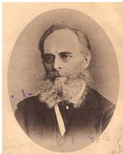
ОЛЕКСАНДР АФАНА́СЬЕВИЧ ПОТЕБНЯ́ 1835—1891 лінгвіст, літературовед, філософ.

Пелех П. М., Передові ідеї у вітчизняній психології в перші десятиріччя XIX ст., в сб.: Нариси з історії вітчизняної психології XIX ст., ч. 1, К., 1955.