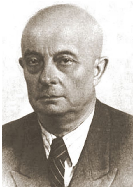
БАЛÉЙ СТЕПАН ВОЛОДИМИРОВИЧ 1885 – 1952 психолог, філософ.

Зеньковский Василий Васильевич // Православная энциклопедия. — М. : Церковно-научный центр «Православная энциклопедия», 2009. — Т. XX. — С. 96-108. — 752 с. — 39 000 экз. — ISBN 978-5-89572-036-3.