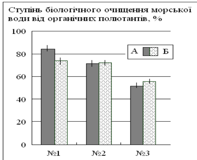
Рис. 2. ПАР- і нафтодеструктивна активність іммобілізованих бактерій за ступенем очищення морської води від вуглеводнів нафти (А), додецилсульфату натрію (Б)

Результати оцінки ПАР- і нафтодеструктивної активності іммобілізованих бактерій за показником ефективності очищення морської води від органічних поллютантів (за присутності перелічених вище ІВМ) представлені на рис. 2.