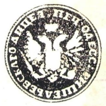
Іл. 2. Штамп бібліотеки Одеського Рішельєвського ліцею

Наведемо положення з царського указу від 5 лютого 1841 року «О распределении учебных пособий Виленской медико-хирургической академии»: «... дабы сделано было распоряжение о распределении академической библиотеки, кабинетов и других учебных пособий таким образом, чтобы относящиеся собственно к врачебной науке поступили без изъятия в Киев, и из прочих пособий взяты были для тамошнего университета только нужные для пополнения его коллекции. Все, что затем останется в излишке, передать другим учебным заведениям, имеющим наиболее нужды в пособиях сего рода» (виділено нами. – М. А.) [19, стб. 221]. Таким чином, остаточний перерозподіл спадщини вищих навчальних закладів Великого князівства Литовського було покладено на міністерство народної освіти.