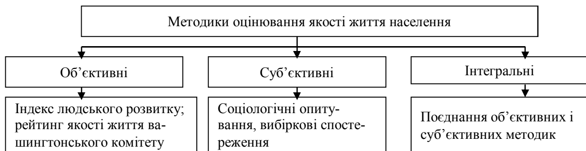
Рис. 1. Класифікація методик оцінювання рівня та якості життя населення

Виклад основного матеріалу. Численні фахівці розробляють власні та певні уніфіковані методики оцінювання рівня та якості життя населення (рис. 1) [3; 5; 6; 10].