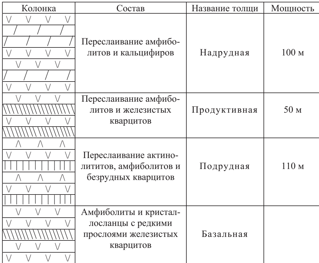
Рис. 1. Схематический разрез Восточно-Капустянского проявления

Анализ литологических колонок пород других разрезов хщевато-завальевской свиты в пределах рассматриваемой области также свидетельствует об их метаксеногенном генезисе. Супракристалльные породы кошаро-александровской свиты и отдельных разрезов нерасчлененной днестровско-бугской серии имеют существенно метатерригенный генезис. На рис. 2 показаны результаты палеорекострукции разреза метаморфических и ультраметаморфических пород по реликтовому циркону на участке Савранского рудопроявления в Побужском районе.