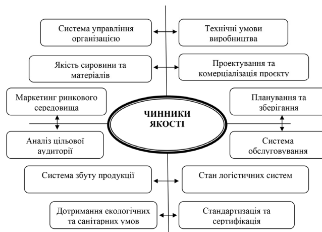
Рис. 1. Чинники забезпечення якості суб'єктів підприємницької діяльності в умовах глобалізації

Серед основних причин незадовільного стану розвитку національної економіки необхідно виділяти не тільки наявність кризових явищ і слабого інноваційного прогресу [3], а й необхідність створення та динамічного втілення нових механізмів забезпечення якості й конкурентоспроможності як продукції, так і підприємств (рис. 2).