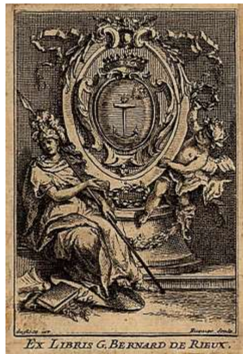
Экслибрис Г. Бернара де Риё

Бернар де Риё любил книги и собрал богатую библиотеку, книги и рукописи из которой переплетались в красный марокен или телячью кожу с оттиснутым гербом владельца (на отпечатке герба, оттиснутого золотом на крышке переплёта «Королевского альманаха» за 1726 год, можно различить букву «G») [1, № 3]. Кроме того, у него имелся гравированный экслибрис [14]. Библиотекарем Бернара де Риё (ок. 1720 г.) был знаменитый в своё время каллиграф Симеон Ле Куто ( Siméon Le Couteux ), работавший также у прославленного библиофила Карла Генриха фон Хойма, чрезвычайного посла польского короля Августа II при французском королевском дворе 3 .