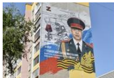
Рис. 2. Мурал в місті Челябінськ

Він стан десятим із тих, що присвячені пам'яті загиблим військовослужбовцям. Ініціатори пояснили вибір будинку, де з'явилося зображення, тим, що будівлю добре видно з залізничні пасажиром поїздів [8]. Тому не лише жителі міста постійно будуть бачити перед собою обличчя війни, а й ті, хто прибув.