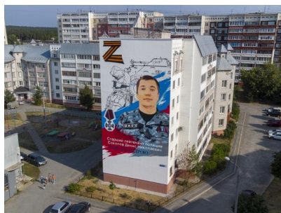
Рис. 3. Мурал в місті Перм