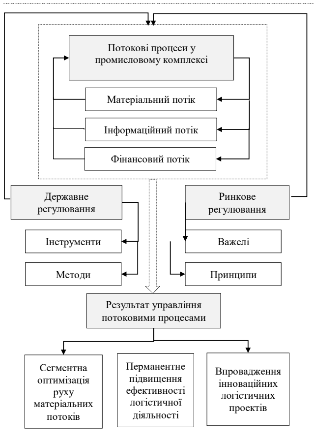
Рис. 1. Модель процесу управління потоковими процесами у промисловому комплексі за умови взаємодії державних та ринкових механізмів

Процес управління потоковими процесами у промисловому комплексі за умови взаємодії державних та ринкових механізмів представлений в моделі (рис. 1), який підтверджує факт необхідності регулювання окремих сегментів логістичного сектору з боку державних інституцій, при цьому слід враховувати відповідні інструменти та методи, а також діючі нормативи та важелі.