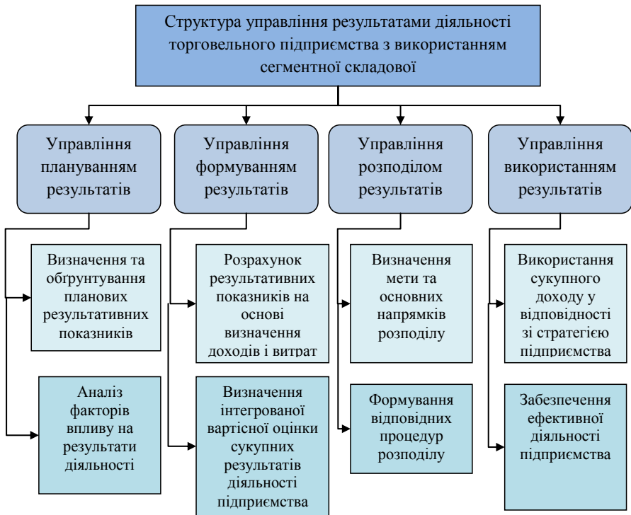
Рис. 1. Структура управління результатами діяльності торговельного підприємства

Планування фінансових результатів передбачає розробку планів щодо обсягів операційної, фінансової та інвестиційної діяльності торговельного підприємства.