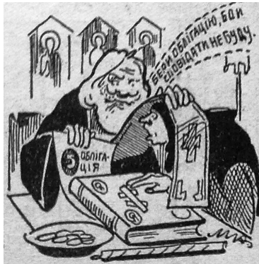
Рис. 3. Карикатура до фейлетону «За облігації батюшка гріхи прощає»

Отже в даній карикатурі представлена церковна тематика, критикується фальшивість священників та їхнє бажання нажитися на парафіянах. Сприйняти комізм карикатури в повній мірі можна за умови наявності в адресата екстралінгвістичного знання (соціального знання про жадібність деяких священнослужителів, які грають на набожності вірян заради власного збагачення). В даному контексті також виникає аналогія з продажем середньовічних індульгенцій, що створює додатковий комічний ефект.