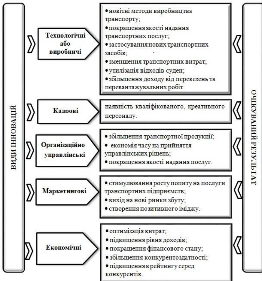
Рис 4. Очікувані результати від впровадження інновацій для транспортних підприємств

Основною рушійною силою для розширення інноваційної діяльності у транспортних підприємств є знання. Тому наявність власної бази знань і можливість доступу до зовнішніх джерел інформації займає суттєву роль в розвитку інноваційної діяльності. На підприємстві повинна бути дієво організована система збирання і обміну інформацією між його структурними елементами. Важливим для здійснення інновацій є наявність висококваліфікованого персоналу та залучення зовнішніх консультантів [10]. Підприємству потрібні кваліфіковані спеціалісти, які здатні набирати нові знання і використовувати їх у практичній роботі. Регулярне підвищення рівня знань і кваліфікації, участь у конференціях і семінарах для обміну досвідом є гарантією майбутнього успіху в інноваційній діяльності. Професійність кадрів є ключовим фактором для інноваційної діяльності на всіх підприємствах галузі послуг, в тому числі на транспортних. Науково-дослідна робота збільшує рівень інформованості і розширює досвід, потрібний в майбутньому для здійснення інновацій [11].