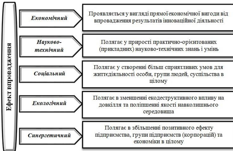
Рис. 2. Види ефектів від впровадження сталого інноваційного розвитку сфери інфраструктури та їх сутність