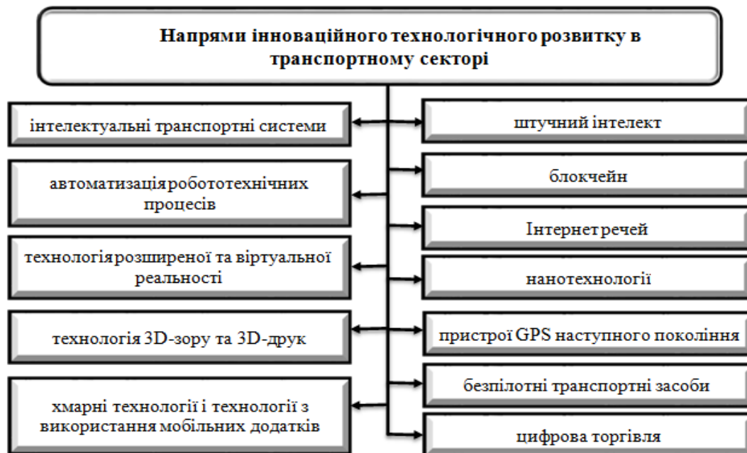
Рис. 5. Вектори сталого інноваційно-технологічного розвитку в інфраструктурному комплексі