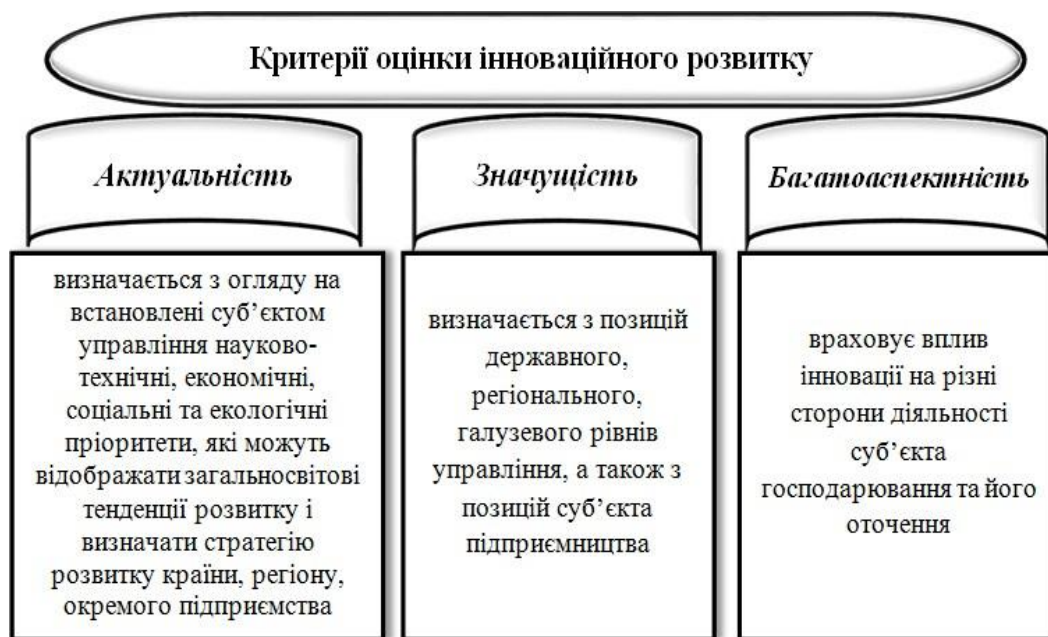
Рис. 1. Критерії оцінки сталого інноваційного розвитку транспортних послуг

транспортної інфраструктури, збуту продукції і послуг потреба в сталому інноваційному розвитку стає важливою для підприємств морської індустрії. Основна ідея інновацій полягає в одночасній наявності трьох складових, які утворюють наступний ланцюжок: новинка або нововведення → процес → ефект або кінцевий результат. Враховуючи це, авторами уточнено значення категорії « стала інновація» – це нововведення, удосконалення існуючого продукту чи послуг, що створюються шляхом технологічного процесу, який використовується у практиці інфраструктурного підприємства для підвищення якості надання послуг, збільшення обсягів виробництва за малими фінансовими, економічними та технологічними витратами [2]. Встановлено кореляцію між категоріями «інновація» та «сталий інноваційний розвиток», який полягає у тому, що розвиток інновації є складовою частиною сталого інноваційного розвитку підприємств, а їх наявність і частотність впровадження в діяльність підприємства визначає активність його сталого розвитку. Враховуючи це, висловлене авторське уявлення категорії сталого інноваційного розвитку підприємства – це процес впровадження результатів творчого потенціалу підприємства через систематичне впровадження нововведень (інновацій) у виробничо-технологічну сферу з метою отримання корисних фінансово-економічних та соціально-економічних результатів, підвищення рівня ділової активності та конкурентоспроможності підприємства [1]. Основні з них подано на рисунку 1.