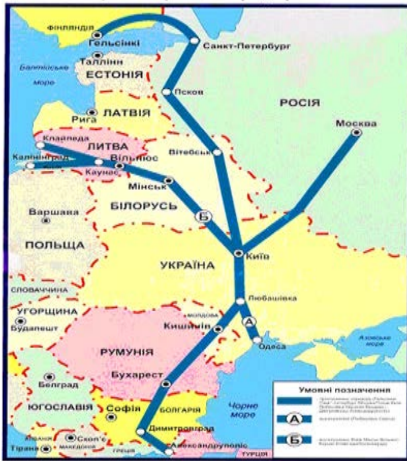
Рис. 2 «МТК №9» [6]