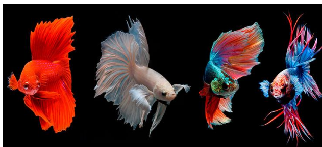
Рис. 3.1 – Півники

Багато початківців у акваріумістиці обирають рибку півника завдяки її витривалості та можливості утримання в невеликому акваріумі без аерації. Проте для комфортного існування, бажано використовувати акваріум об'ємом від 20 л з фільтром, підігрівом та кришкою, дотримуючись температурного режиму 24–26 °C і регулярно підмінюючи воду(рис. 3.1).