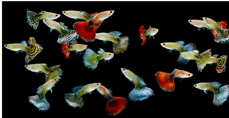
Рис. 3.8 – Гупі

Гупі — витривалі, але вимогливі до умов утримання рибки, яких найкраще тримати зграйкою від 6 особин (з перевагою самок) у накритому акваріумі від 50 літрів. Вони потребують чистої, помірно жорсткої води (24–26 °С, рН 7–8.5), яскравого освітлення, густих заростей рослин та регулярних підмін води, а селекційні форми — ще й стабільних параметрів середовища(рис. 3.8).