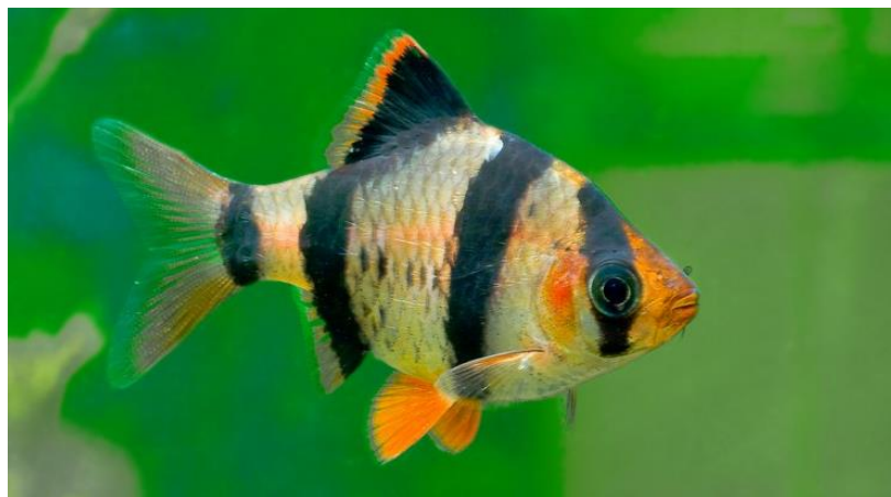
Рис. 3.3 –Барбус

Барбусів слід утримувати зграйкою від 6–10 особин у видовженому акваріумі об'ємом від 30 літрів (залежно від виду), обов'язково з кришкою через їхню активність. В акваріумі бажано поєднувати густі зарості рослин із відкритими зонами для плавання, використовуючи темний ґрунт, корчі та каміння як декорації(рис. 3.3).