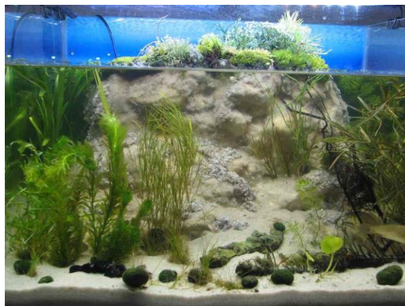
Рис. 1.6 – Біотопний акваріум