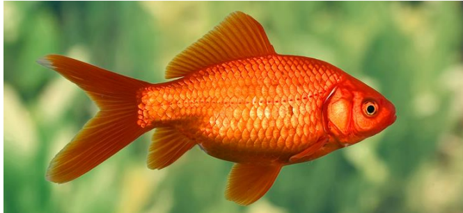
Рис. 3.12 – Золота рибка

Золоті рибки — великі, активні й досить «брудні» мешканці акваріума, тому на одну особину потрібно щонайменше 50 літрів води, потужну фільтрацію, аерацію та щотижневі підміни (25–30%). Вони плавають у всіх шарах води, риють в ґрунті, тому краще використовувати округлу гальку, твердолисті або штучні рослини та уникати декорацій з гострими краями. Оптимальна температура — 18–23 °С, параметри води: рН 6.0–8.0, жорсткість 8–25 °dGH.