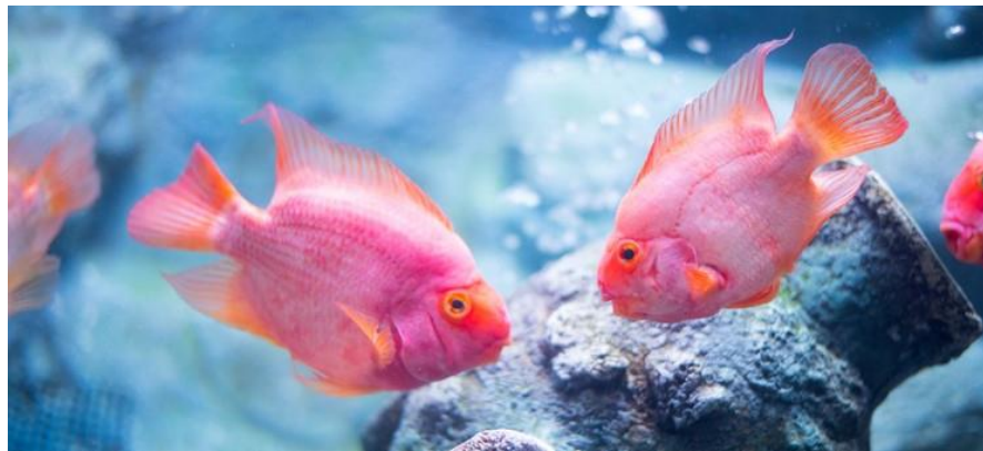
Рис. 3.10 – Риби – папуги

Риб-папуг слід утримувати в закритому акваріумі з потужною зовнішньою фільтрацією, аерацією та підмінами води (20–30% щотижня), оскільки вони великі й виробляють багато відходів. Найкраще тримати їх зграєю 3–5 особин на темному тлі, з піщаним або гальковим ґрунтом, корчами та укриттями, уникати надто яскравого світла і використовувати лампи з червоним спектром для підкреслення забарвлення. Рослини — бажано жорстколисті й добре закріплені, бо риби часто їх викопують(рис.3.10).