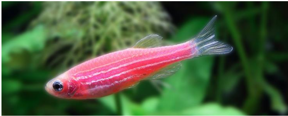
Рис. 3.4 – Даніо

Більшість видів даніо — це невеликі мирні стайні рибки, яких бажано утримувати зграйкою від 6 особин у закритому акваріумі об'ємом від 50 літрів. Вони потребують яскравого освітлення, чистої води з фільтрацією та аерацією, а також вільного простору для плавання і густо засаджених рослинами ділянок(рис. 3.4).