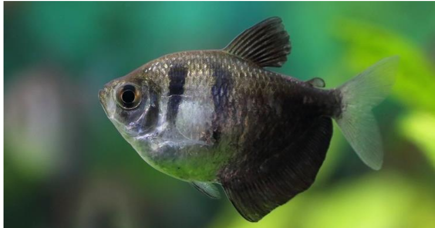
Рис. 3.6 – Тернеція

Тернеції — витривалі й активні рибки, які найкраще почуваються в зграйці з 8–10 особин у накритому акваріумі від 60 літрів. Для них бажано використовувати темний дрібний ґрунт, корчі як декор і приглушене освітлення, яке можна створити за допомогою плаваючих рослин(рис.3.6).