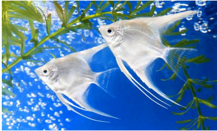
Рис. 3.2 – Скалярії

Для комфортного утримання скалярій потрібен акваріум від 100 літрів на пару з висотою щонайменше 50 см. Найкраще тримати їх зграйкою від 6 особин, забезпечивши зони з густою рослинністю, корчами та укриттями, оскільки риби мають ієрархічну поведінку й потребують простору для плавання та укриттів (рис. 3.2).