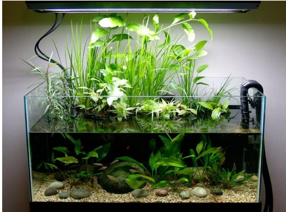
Рис. 1.9 – Палюдаріум

Палюдаріум — це поєднання водної та наземної рослинності. Для оформлення такого акваріума часто використовують мохи, корчі та інші природні декоративні елементи(рис.1.9).