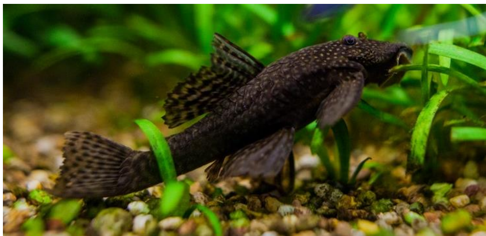
Рис. 3.5 – Анциструс

Анциструсів можна утримувати в більшості тропічних акваріумів об'ємом від 50 літрів, забезпечивши їм укриття, корчі для зіскрібання целюлози та приглушене освітлення у вечірній час. Рибки невибагливі до параметрів води, головне — підтримувати температуру 22–24 °С, хорошу аерацію і уникати гострокутного ґрунту(рис. 3.5).