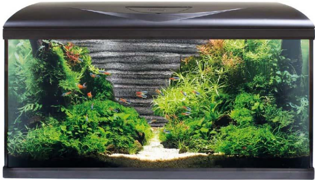
Рис. 1.1 – Стандарстний акваріум

стежити за їх пересуваннями, а не просто встановити в інтер'єрі яскравий аксесуар (рис. 1.1).