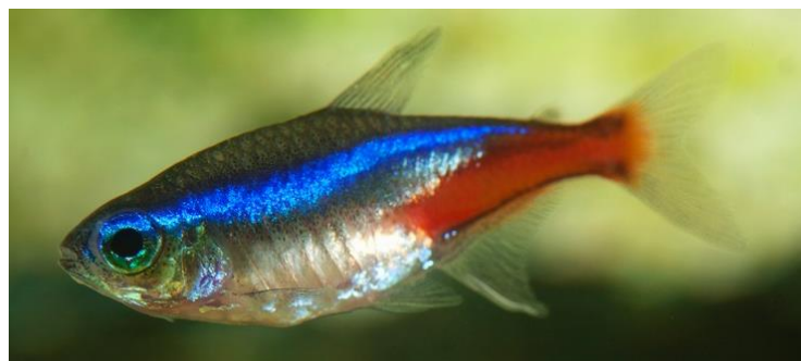
Рис. 3.11 – Неони

Неонів слід утримувати зграйкою від 6–8 особин у стабільному акваріумі об’ємом від 50 літрів із приглушеним освітленням, фільтрацією та підмінами води (25–30% щотижня). Вони віддають перевагу м’якій, слабо кислій воді (23–25 °С, рН 5.5–5.7), густій рослинності, укриттям і темному ґрунту, який підкреслює їх яскраве забарвлення(рис.3.11).