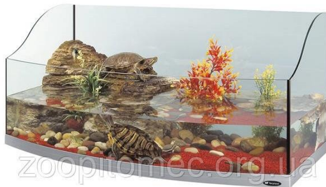
Рис. 1.8 - Акватераріум

Акватераріум призначений для одночасного утримання та демонстрації як акваріумних мешканців, так і тераріумних тварин — зокрема рептилій і земноводних( рис. 1.8).