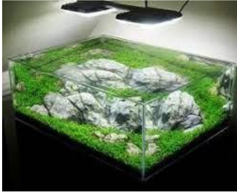
Рис. 1.2 - Акваріум «корито»

"Акваріум - «ширма" має високу декоративність, оскільки рибки в ньому будуть добре проглядатися через малу ширину ( 1/3 довжини), тоді як висота складає половину довжини. У них добре тримати великі і високі рослини, а водна каламуть не впливає на видимість. Але такі акваріуми мають невелику площу поверхні води, тому в нижній частині буде мало кисню, що потребує потужної аерації, і як наслідок, це буде некомфортно для риб. (рис.1.3).