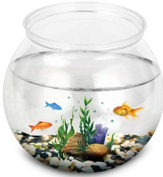
Рис. 1.4 – Кулясті акваріуми

інших параметрів. Через форму акваріума прикріпити який-небудь прилад до стінки неможливо. На стінках ємності може осідати бруд.