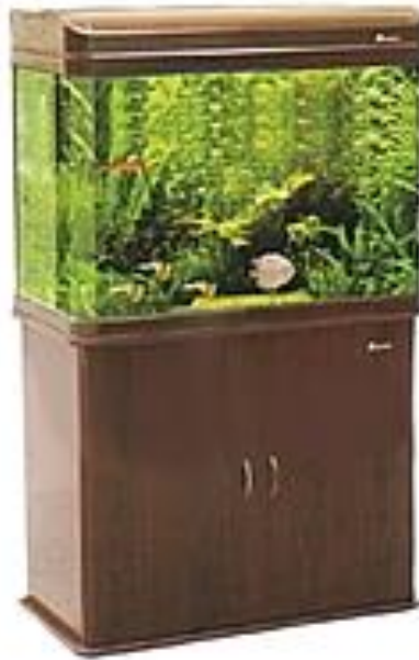
Рис. 1.3 – Акваріум ширма

Класичний прямокутний акваріум ідеально підходить для розміщення у відкритих меблевих нішах, стінних прорізах або на полиці. Сучасні виробники пропонують як компактні моделі, так і великогабаритні ємності, до яких можна підібрати кришки та підставки, що гармоніюють з інтер'єром. Для їх виготовлення використовуються найрізноманітніші матеріали: пластик, масив дерева, метал тощо.