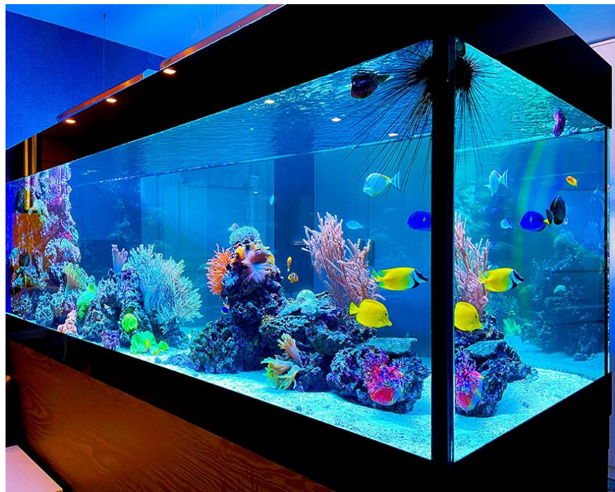
Рис. 1.5 – Морський акваріум

Морські акваріуми призначені для утримання морських риб і рослин. Зазвичай, морський акваріум має великі розміри (від 400 л), оскільки морські риби крупніші прісноводних. Для такого акваріуму краще підбирати риби подібної поведінки та однакових розмірів. Заселення акваріуму проводиться із розрахунку 1 см довжини риби на 5-8 л води. Морський акваріум більш трудомісткий в експлуатації, оскільки морські організми більш вимогливі до середовища проживання. Потрібна підвищена увага до стану води (щільність, кислотність, температура і ін.). Особливо складно утримувати рифовий морський акваріум. Він досить дорогий і складний в експлуатації. (рис.1.5).