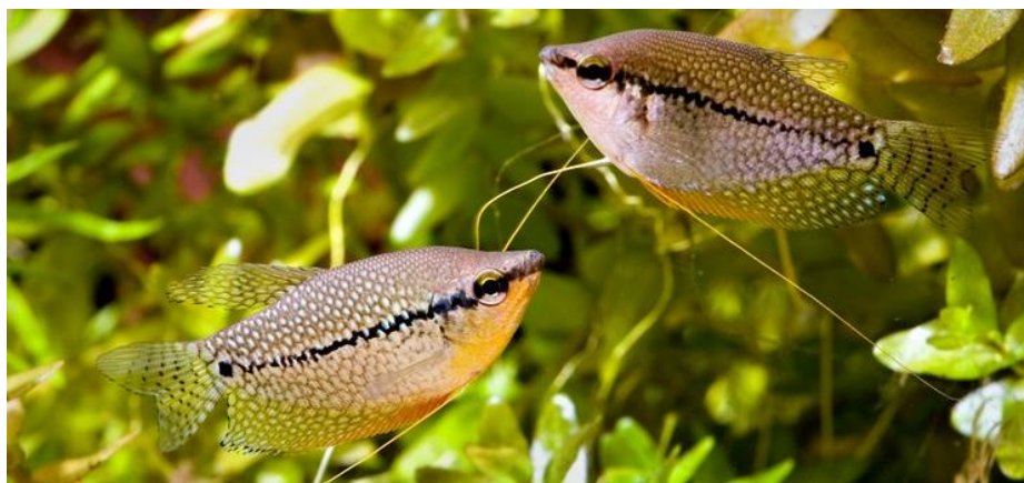
Рис.3.13 – Гурамі

Гурамі — витривалі рибки з лабіринтовим диханням, які добре адаптуються до різних умов, але потребують стабільної температури (25–27 °С) і слабкислої води (рН 6.0–6.8). Для карликових і медових форм підходить акваріум від 20 літрів на пару, для більших видів — від 80–100 літрів. Важливо використовувати покривне скло, уникати сильного течії та створити зони з живими рослинами й плаваючою зеленню для укриттів і побудови гнізд.