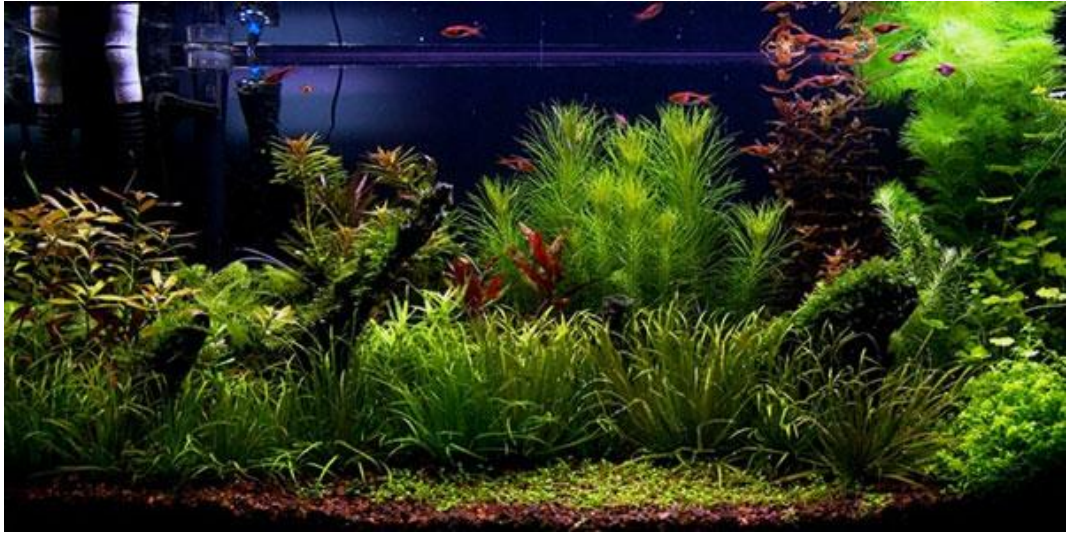
Рис. 1.7 – Голландський акваріум

Голландський акваріум — це тип акваріума, орієнтований на вирощування акваріумних рослин, тому його часто називають «травником». У такому акваріумі рослини висаджують не поодинокі, а щільними групами, що дозволяє створити ефект густих підводних заростей та приховати стебла. При оформленні дотримуються принципу ярусності: високі рослини розміщують на задньому плані (рис. 1.7).