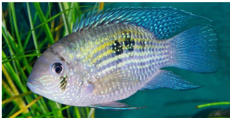
Рис. 3.9 – Акари

Акари — великі й активні цихліди, для яких необхідний просторий акваріум від 100–150 літрів на одну особину, з фільтрацією, аерацією та стабільними параметрами води (22–25 °С, рН 6.0–8.0, жорсткість 8–15°dGH). Вони потребують середнього гравію без гострих країв, укриттів, корчів і міцних рослин у горщиках, а також регулярних підмін води й контрольованого освітлення зі спектром, що підкреслює їх забарвлення(рис.3.9).