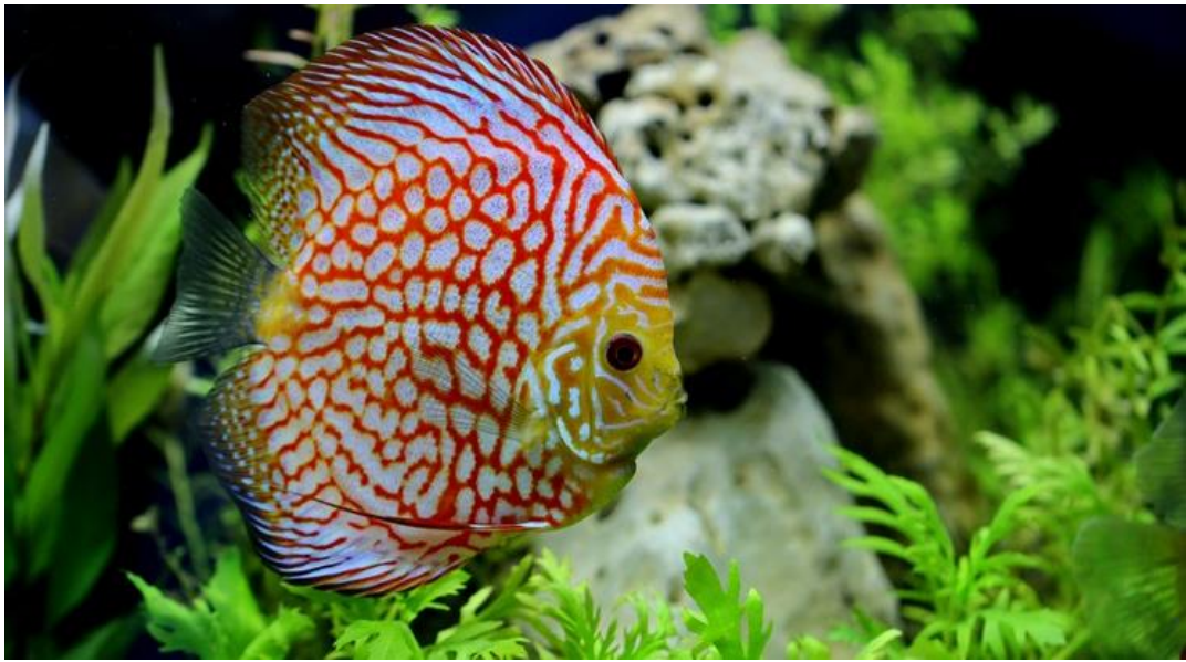
Рис. 3.14 – Дискус

Дискуси — вимогливі, теплолюбні риби, яких утримують у просторому, стабільному акваріумі об'ємом від 250–400 літрів із висотою водного стовпа не менше 50 см. Вони потребують спокійного місця, фільтрації, аерації, стабільних параметрів води (27–30 °С, рН 5.5–6.5, жорсткість 1–12 °dGH) та регулярних підмін (щотижня 25% або щодня по 10–20%). Акваріум може бути як з рослинами, так і без оформлення, але будь-який варіант вимагає особливої чистоти і контролю якості води(рис.3.14).