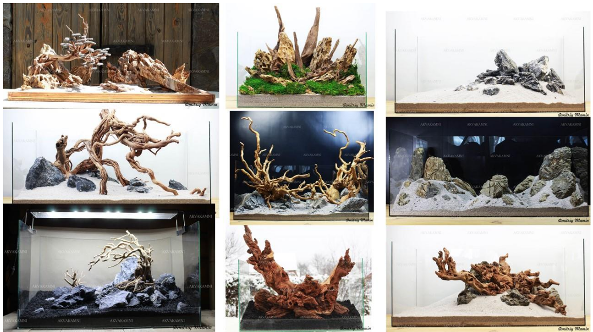
Рис. 2.1 - Популярні тренди в аквадизайні

Зростає інтерес до акваріумів з відкритою водною поверхнею, де рослини частково виходять за межі води, створюючи єдність водного та повітряного простору. Це дозволяє включати у композицію надводні мохи, орхідеї, бромелієві та інші декоративні елементи(рис.2.1).