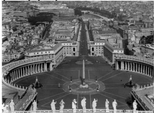
Бароко: площа Петра та Павла (Рим)