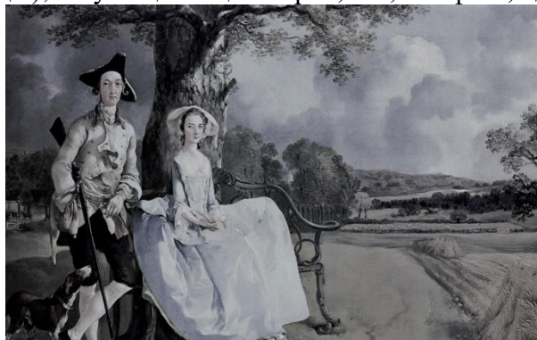
«Портрет подружжя Ендрюс» - картина англійського художника Томаса Гейнсборо (1750)

Нові жанрові форми: в прозі – усі різновиди роману, філософський діалог; в драматургії – сатирична комедія, буржуазна драма, історична та філософська драма (трагедія); в публіцистиці – нарис, есе, памфлет, «досвід».