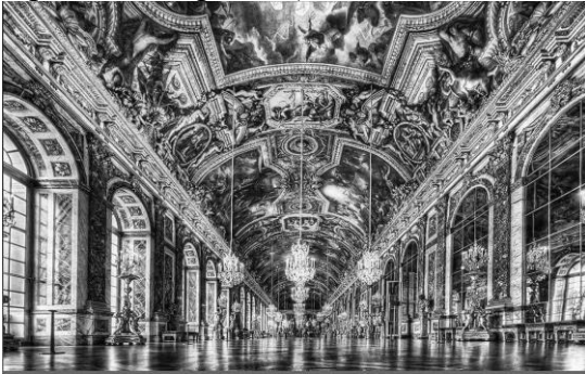
Класицизм: Дзеркальна галерея. Лувр. Франція

основними у визначені даної естетики: 1. Твір має діяти за законом трьох єдностей : єдність місця – події п'єси повинні відбуватися в одному місці, зміни декорацій не допускались; єдність часу – події мають відбутися за 24 години; єдність дії – повинна бути лише одна сюжетна лінія, що не обтяжена побічними епізодами. 2. Суворе дотримання законів жанру , поділ на високі жанри – оду, трагедію, епос і низькі – комедію та сатиру. І високі, і низькі жанри зобов'язані були наставляти публіку. 3. Герой, як правило, король або міфологічний персонаж. 4. Трагедія повинна мати п'ять актів і бути написана олександрійським віршем (шестистопним ямбом).