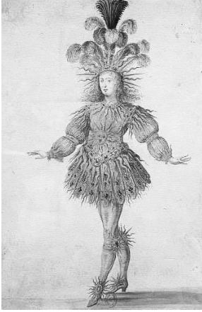
Людовік IV. Король-сонце

Як вже було сказано вище, класицизм у Європі досягає найвищого свого розквіту у Франції і безпосередньо пов'язаний