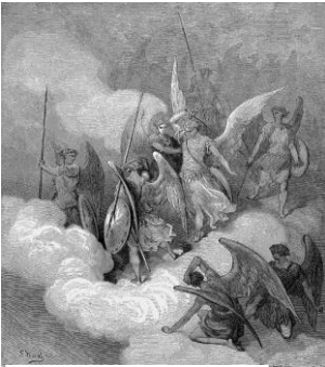
Гравюра Гюстава Доре "Війна на небесах"

Біблійні мотиви послужили сюжетним елементом в поемі Мільтона «Втрачений рай» , присвяченій долі людського роду. Композиційно поема складається з дванадцяти книг, написаних білим віршем. Сюжет заснований на помсті Сатани Богу. Знарядям помсти Сатана обирає найкраще творіння Всевишнього – людину. Йому вдається спокусити Єву, але Адам добровільно куштує плід з дерева пізнання, щоб розділити з коханою долю, бути вигнаним з раю. Описана