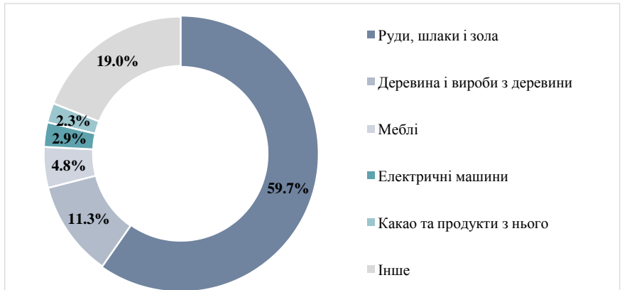
Рисунок 7.17 - Структура експорту товарів з України до Австрії за видами продукції у 2021 році ( % до загального обсягу експорту)

Структура експорту товарів України до Австрії включає руди, шлаки і золу (59,7%), деревину і вироби із неї (11,3%), меблі (4,8%), електричні машини (2,9%), какао та продукти з нього (2,3%), іграшки (1,9%), вироби з чорних металів (1,7%) (рис. 7.17).