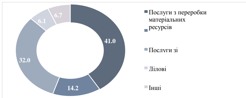
Рисунок. 7.18 - Структура експорту послуг з Австрії до України за видами у 2021 році (% від загального обсягу)