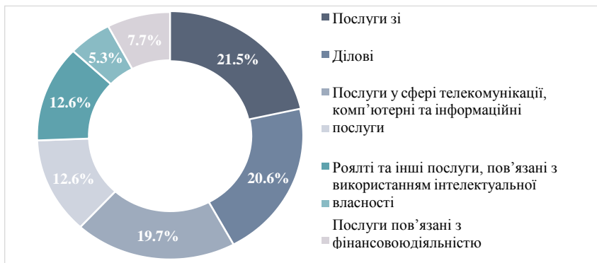
Рисунок 7.19 - Структура імпорту послуг з Австрії до України за видами у 2021 році (% від загального обсягу)

Розглянемо структуру імпорту послуг України з Австрії (рис.7.19). Імпорт включає в себе транспортні послуги, послуги пов'язані з подорожами, послуги з будівництва, послуги із страхування, послуги, пов'язані з фінансовою діяльністю, роялті та інші послуги, пов'язані з використанням інтелектуальної власності, послуги у сфері телекомунікації, комп'ютерні та інформаційні послуги, ділові послуги [50].