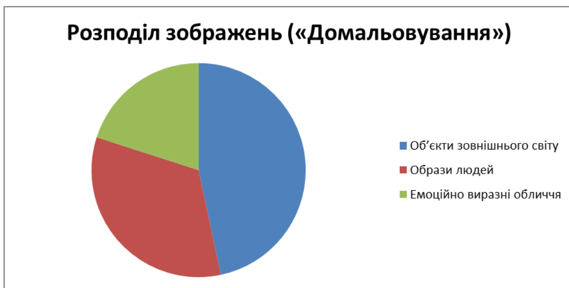
Графік- діаграма 3