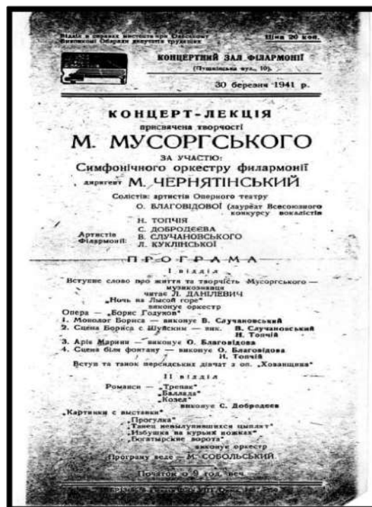
Додаток Е. Афіша концерту – лекції, 30 березня 1941 року, присвяченої творчості М. Мусоргського. Диригент – М. Чернятинський, солістка О. Благовидова і ін.