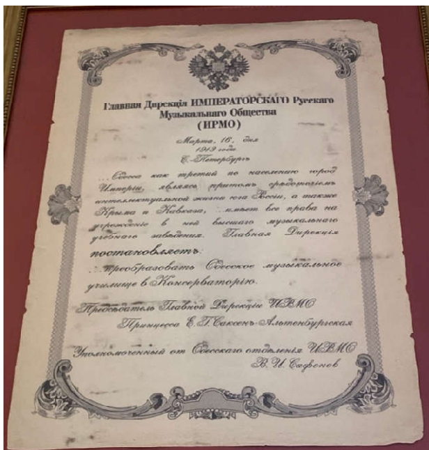
Додаток Г. «Постанова про реформування Одеського музичного училища в консерваторію, 16 березня, 1913 рік».