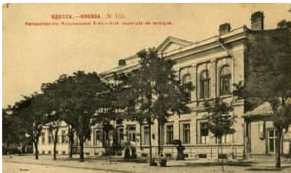
Додаток Б. Одеса. Будівля імператорського музичного товариства на вул. Новосельського 63