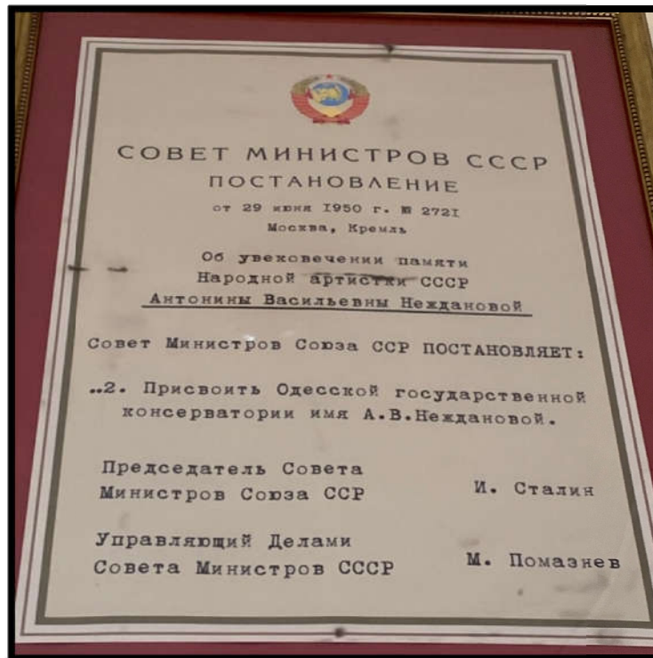
Додаток Д. «Постанова про надання консерваторії ім'я співачки Антоніни Василівни Нежданової. 29 червня, 1950 року». Фото зроблене авторкою.