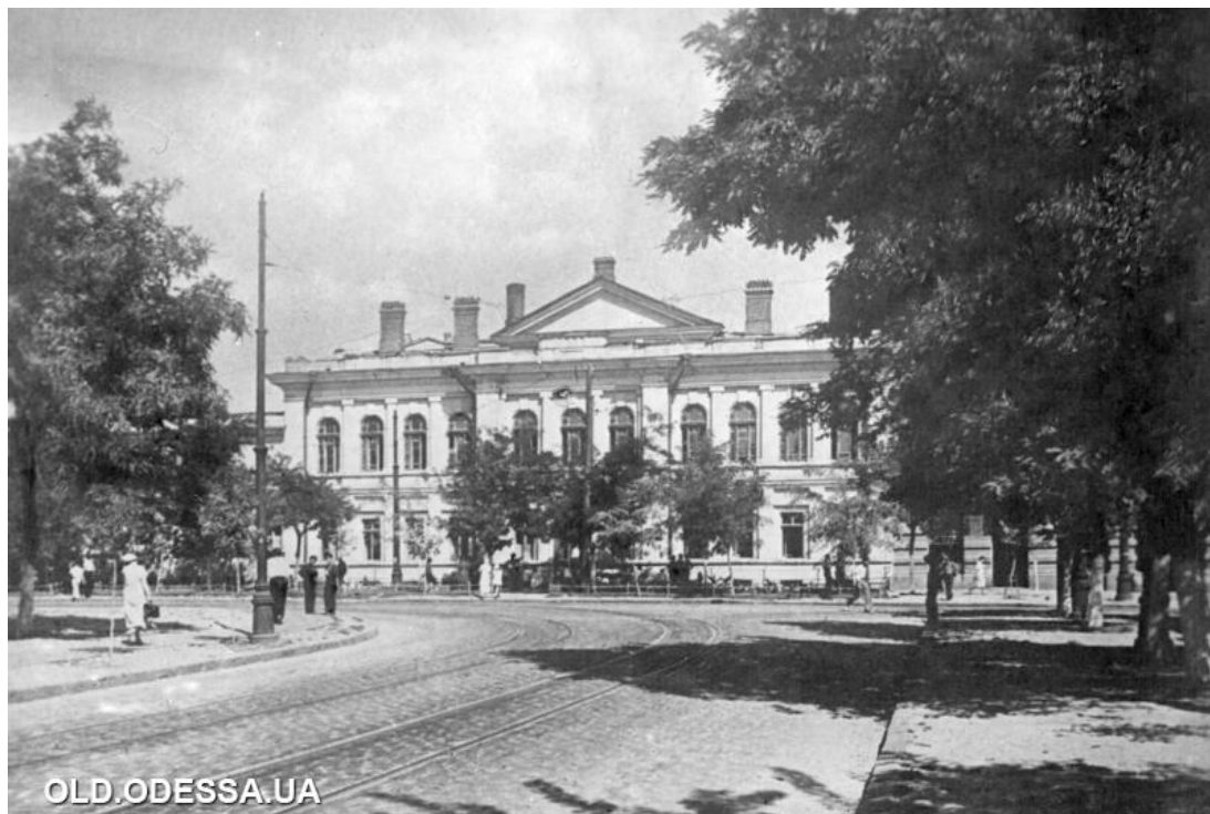
Додаток А. «Одеса. Державна консерваторія. Фото Б. Левіта. Поштова картка».

Джерело: URL: http://viknaodessa.od.ua/old-photo/?konservatoriya [1].