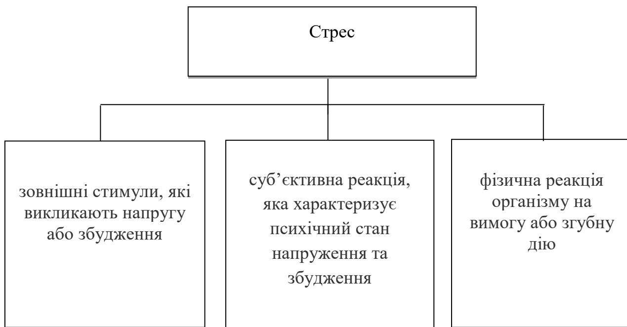
Рис.1.1 Значення терміну «стрес»

Узагальнюючи різні погляди на природу стресу в сучасній науковій літературі, можна припустити, що термін «стрес» використовується принаймні у трьох значеннях (рис.1.1).