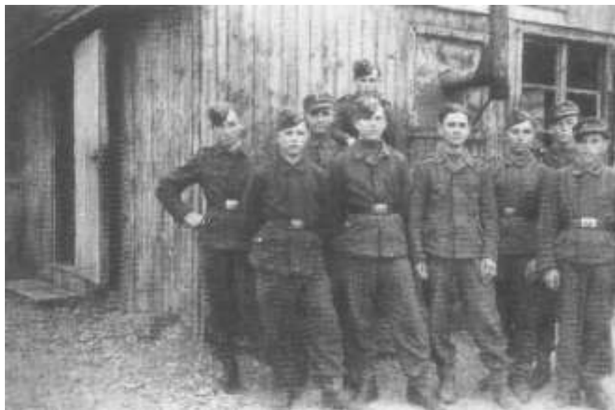
Українські юнаки у вишкільному таборі у місті Заальбург (Осінь 1944 року)