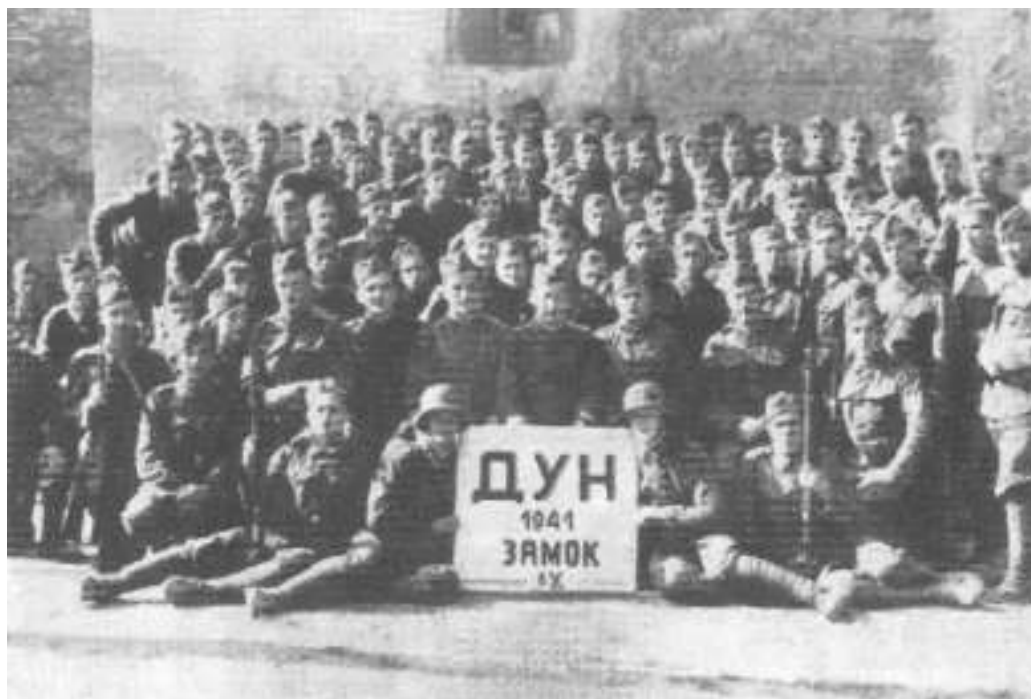
Сотня батальйону «Роланд»