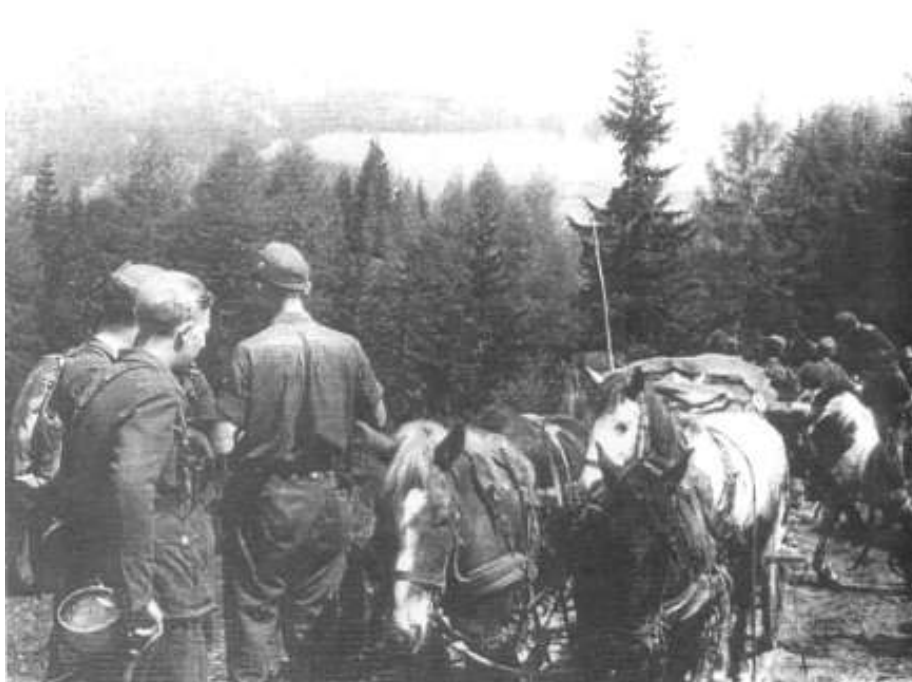
Перехід 1-ої УД УНА через Альпи. Травень 1945 р.