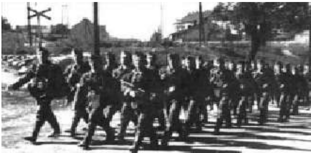
Третя сотня «Нахтігалю». Між Тернополем та Вінницею