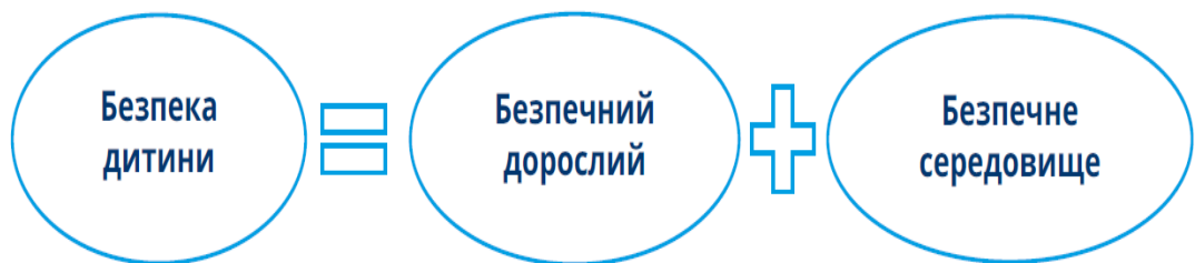
Схема 1.1. Формула безпеки дитини

Батькам важливо розуміти, що є безпекою для дитини та як стати для неї безпечним дорослим [11].