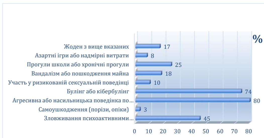
Рис.3.1. Розподіл відповідей на питання «Чи проявляли ви будь-яку з наступних деструктивних дій протягом останнього року?»

17% респондентів не повідомили про будь-яку з перерахованих вище деструктивних дій. Зобразимо результати графічно