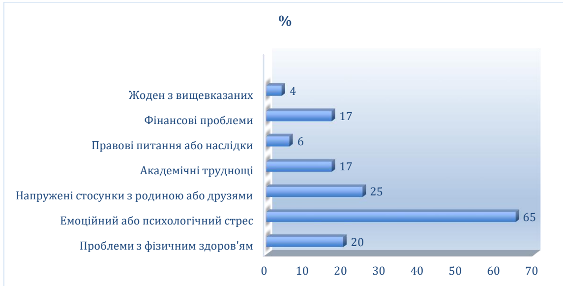
Рис.3.4. Розподіл відповідей підлітків на питання «Чи вважаєте ви, що деструктивна поведінка мала негативний вплив на ваше життя? Виберіть усе, що підходить»

здоров'я в школах та сприяння відкритому діалогу.