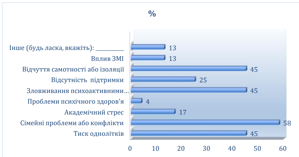
Рис.3.2. Розподіл відповідей підлітків на питання «Якщо ви брали участь у деструктивній поведінці, згаданій вище, які причини чи фактори вплинули на вашу участь?»

Менша частка респондентів повідомила про ризиковану сексуальну поведінку, вандалізм або пошкодження майна, самоушкодження, а також азартні ігри чи надмірні витрати.