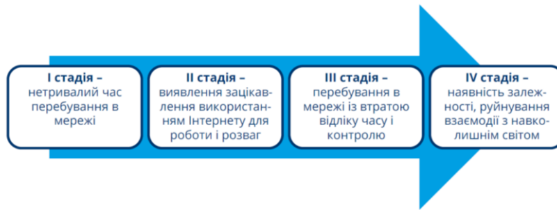
Рис.1.2. Стадії виникнення інтернет – залежності

Деструктивна поведінка загрожує в першу чергу благополуччю самого підлітка, негативно впливає на його психічне, фізичне, ментальне здоров'я, створює підґрунтя для поя-ви значних психологічних і соціальних девіацій у дорослому житті.