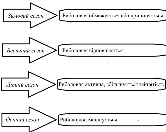
Рис. 2. Сезонність діяльності у рибпромисловому комплексі

Є проблеми з пошуком та утриманням кадрів у рибпромисловому комплексі України. Це пов'язано з низькою оплатою праці, нестабільністю зайнятості, важкими умовами праці та відсутністю соціальних гарантій.