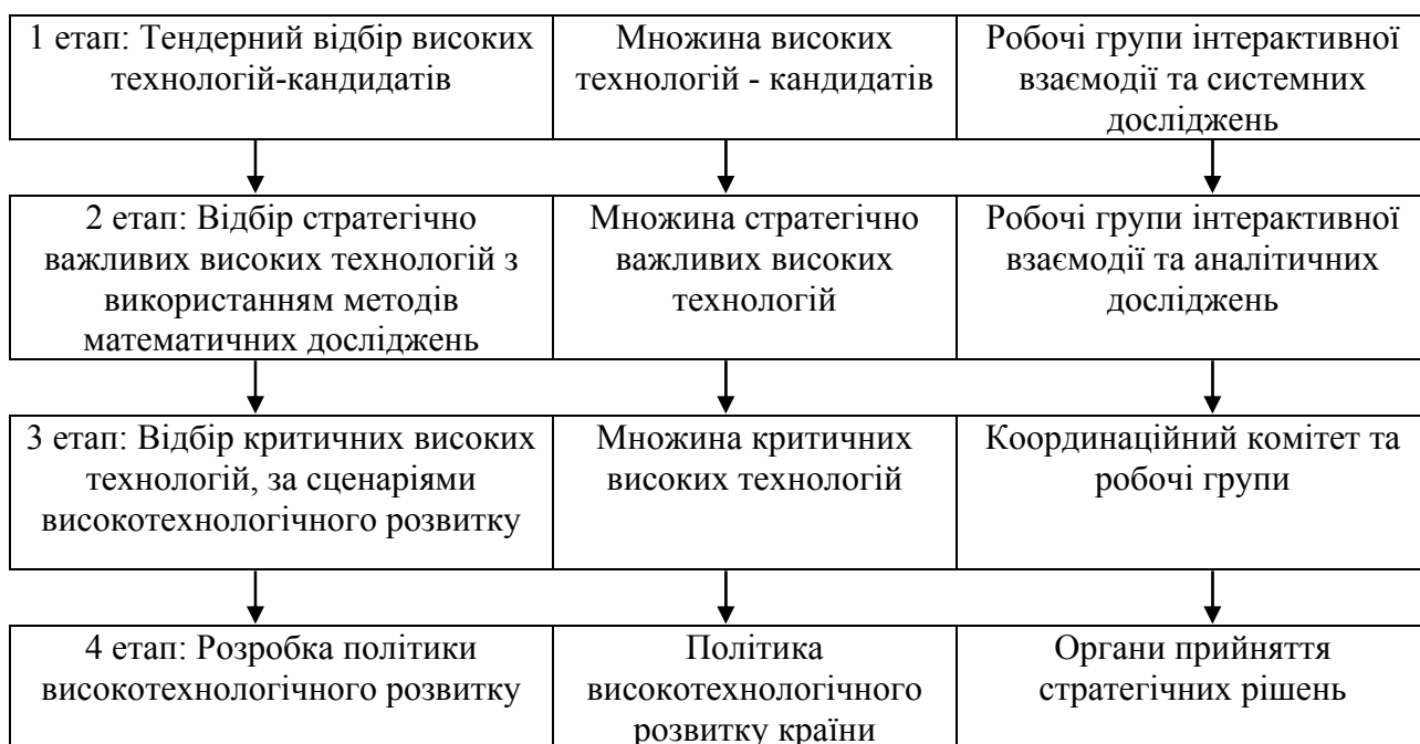
Рисунок 1.3 – Процес відбору критичних високих технологій та формування політики високотехнологічного розвитку (складено на основі [22])

В цілому ця робота розділяється на дві якісно різні частини: короткострокового і довгострокового передбачення. Робота з короткотермінового передбачення полягає у відборі до групи критичних вже добре розроблених в Україні важливих технологій, на які є (або найближчим часом може з'являтися) великий попит на світових ринках. Наприклад, для нашої країни такими можуть бути космічні та авіаційні технології. Вживаючи для групи критичних технологій методи системного аналізу одночасно з методами якісного аналізу (такі як методи Дельфі, перехресного впливу, Сааті, морфологічного аналізу, моделей Байєса та ін.), розробляються сценарії і політика майбутнього високотехнологічного розвитку держави терміном на 5–10 років. Процес відбору критичних технологій та формування політики високотехнологічного розвитку промислового сектора держави схематично представлено на рис. 1.3