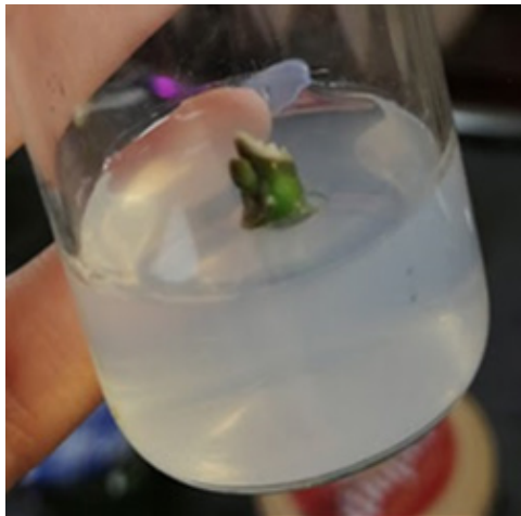
Рис. 3. Набухання пазушної бруньки Juglans regia на 3-й день культивування на середовищі DKW

Починаючи з 3-ої доби культивування спостерігали набухання пазушної бруньки у експлантів (рис. 3). Надалі відбувалися процеси проліферації і розвитку пагону.