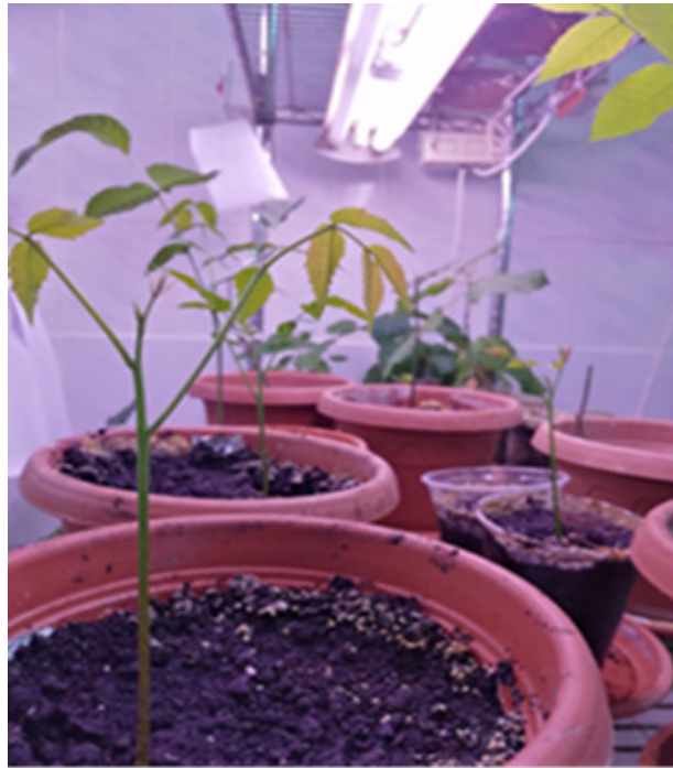
Рис. 1. Молоді паростки Juglans regia отримані в умовах адаптаційного боксу

Як ініціальні експланти для введення в культуру in vitro використовували частини стебла і бруньки молодих паростків рослини, пророщених міні-тепличним методом з плодів Juglans regia в умовах адаптаційного боксу (рис. 1).