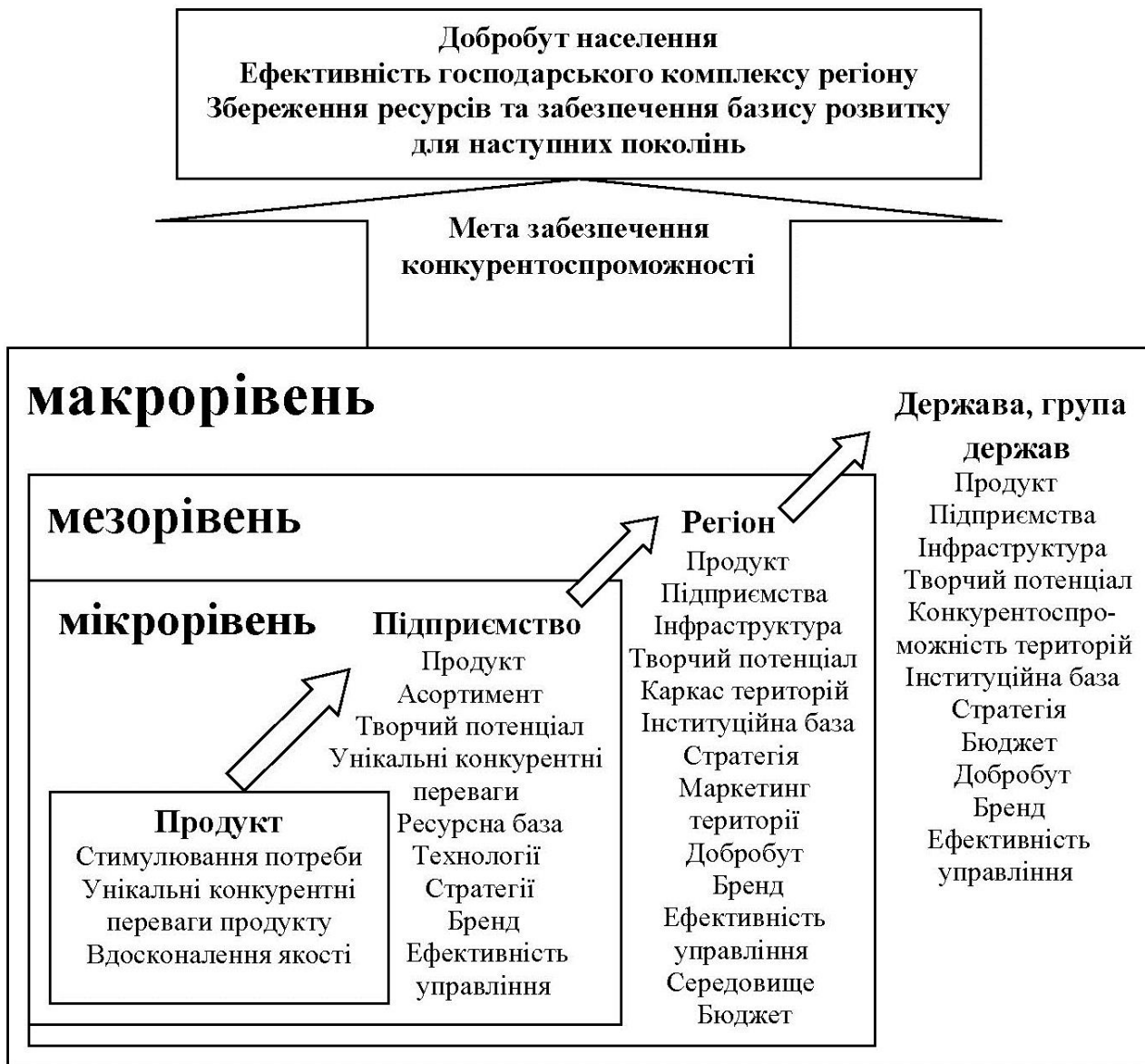
Рис. 1. Концептуальна схема формування конкурентних переваг територій на мікро-, мезо- та макрорівнях

Крім цього, особливої уваги заслуговує питання взаємозв'язку факторів регіональної конкурентоспроможності та конкурентних переваг. Фактор регіональної конкурентоспроможності – це умова, рушійна сила конкурентоспроможності регіону. Л.Шеховцева визначає фактор конкурентоспроможності як здатність створювати умови для стійкого розвитку території шляхом стимулювання і впливу на окремі аспекти конкурентоспроможності. Але автор розглядає дане поняття однобоко, не враховуючи фактори негативного впливу.