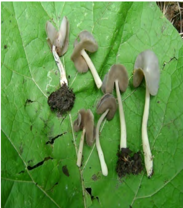
Рис.2. Плодові тіла Helvella ephippium Fig.2. Fruit bodies of Helvella ephippium

Комінтернівський р-н. біля с. Ліски, штучне лісонасадження, серед торішнього листя на ґрунті, 30.05.2010 (Зібрано 13 зразків). Визначено Придюк М.П. Зразки є ідентичними за діагностичними ознаками виду. MSUD-F 0003.