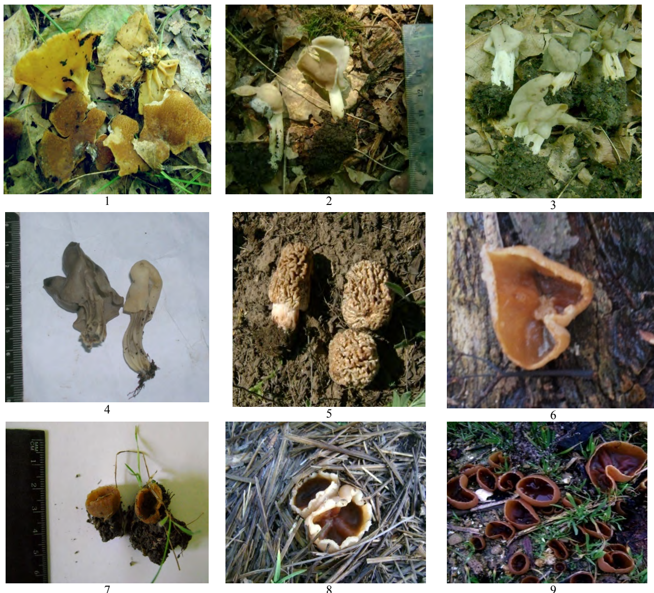
Рис.1. Аскоміцети (Pezizales) Одеської області (плодові тіла: 1 – Helvella acetabulum , 2 – H. elastica , 3 – H. crispa , 4 – H. lacunosa , 5 – Morchella steppicola , 6 – Peziza ampliata , 7 – P. catinoides , 8 – P. repanda , 9 – P. varia