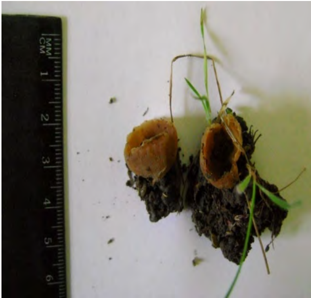
Рис.4. Плодові тіла Peziza catinoides Fig.4. Fruit bodies of Peziza catinoides