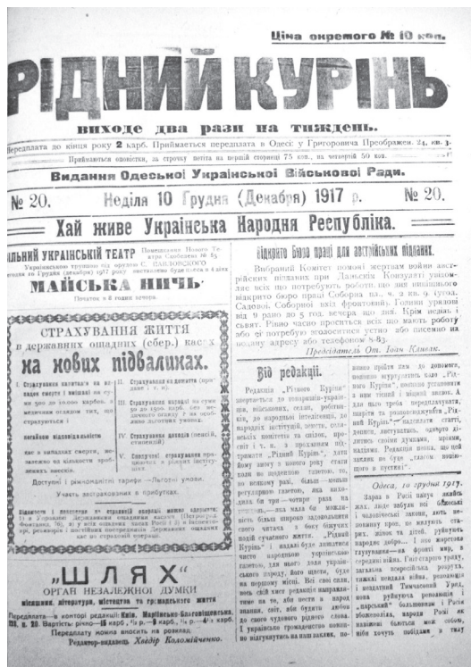
Ил. 4. Газета «Рідний курінь».