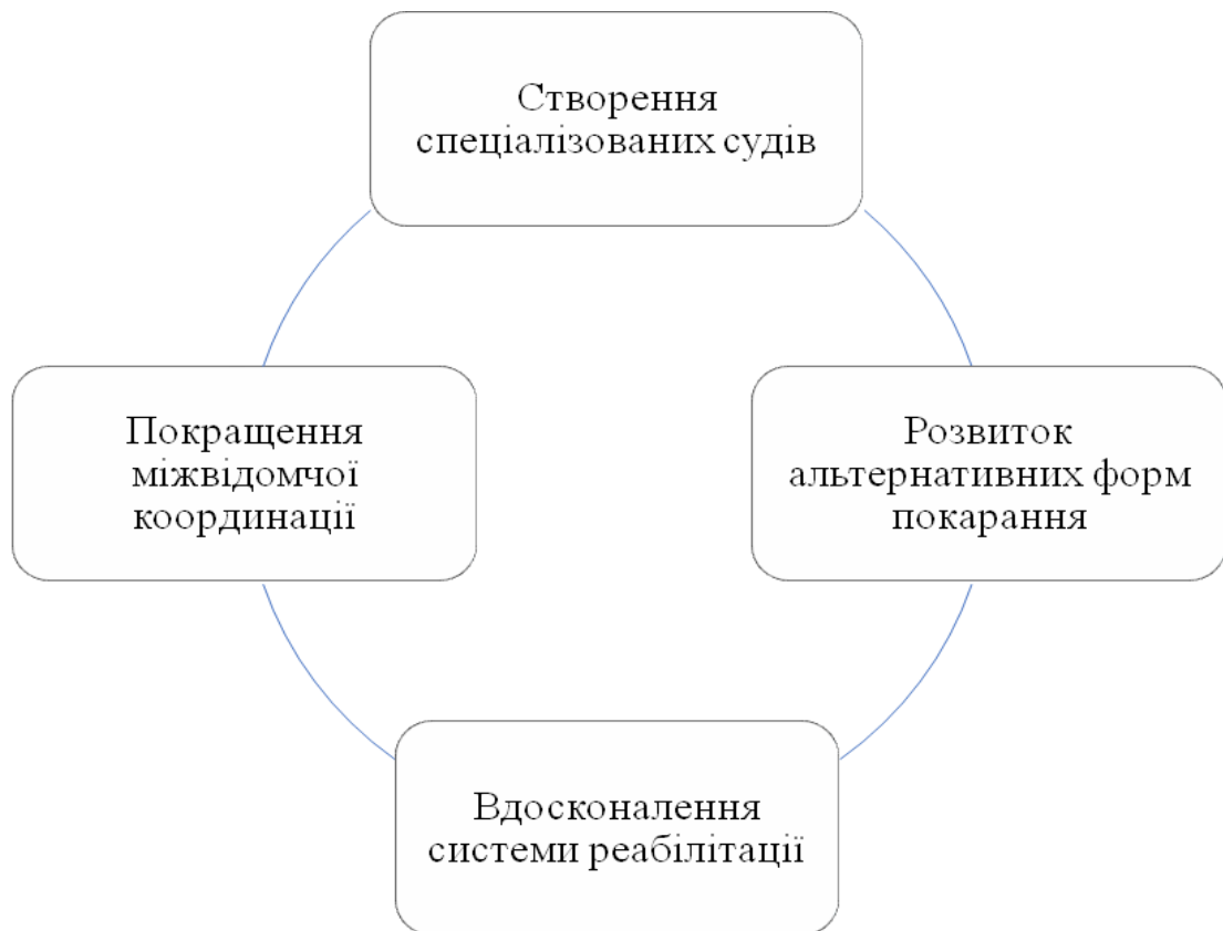
Рис. 4.3. Потребують першочергового вирішення

технічної бази та підготовки фахівців. Особливо це стосується програм профілактики та раннього втручання.