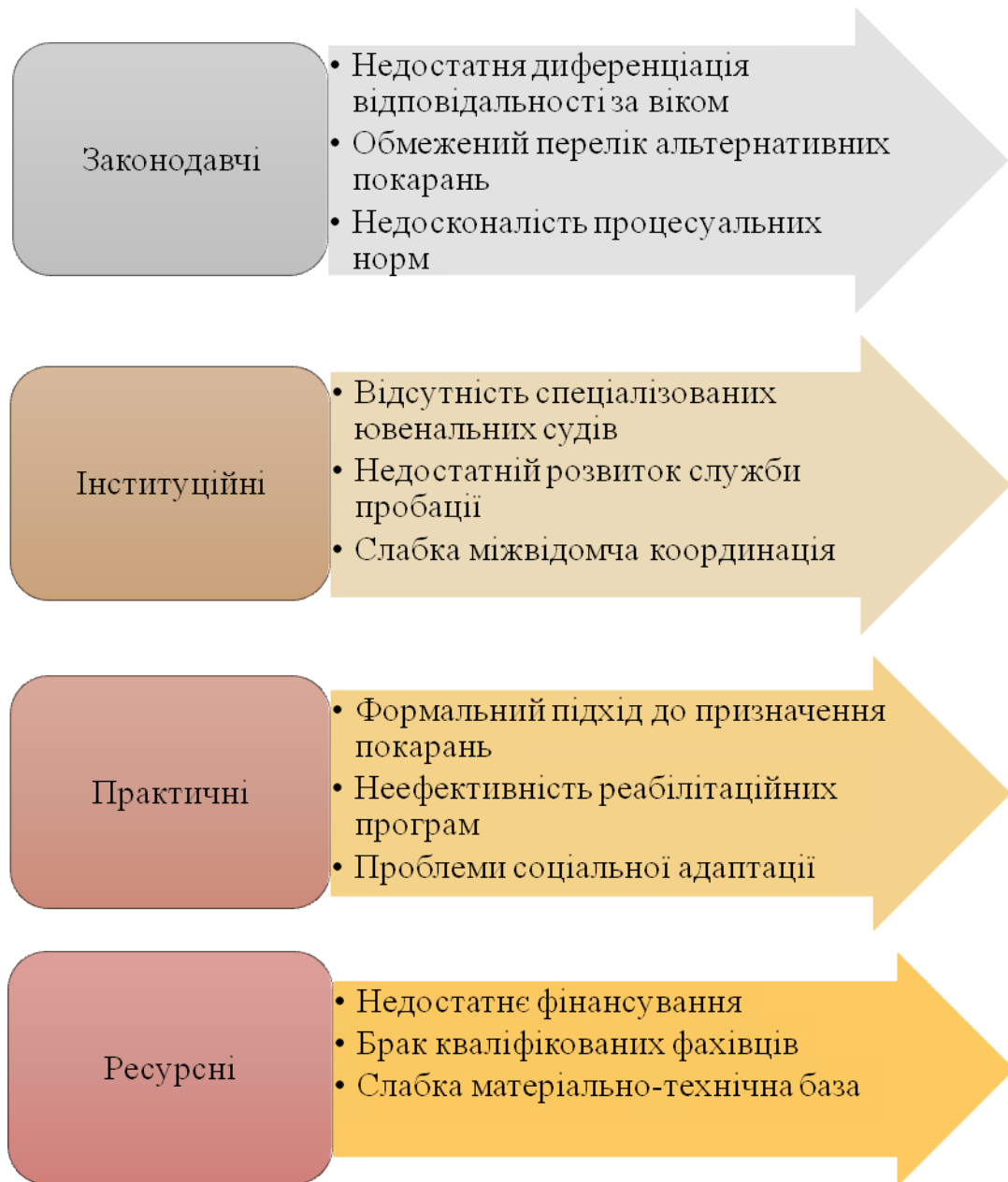
Рис. 4.1. Проблеми застосування кримінальної відповідальності до неповнолітніх в Україні

застосовувати позбавлення волі там, де можна було б обмежитися іншими заходами впливу.