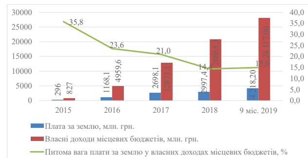
Рис. 2. Питома вага плати за землю у власних доходах місцевих бюджетів у 2015–2019 рр.