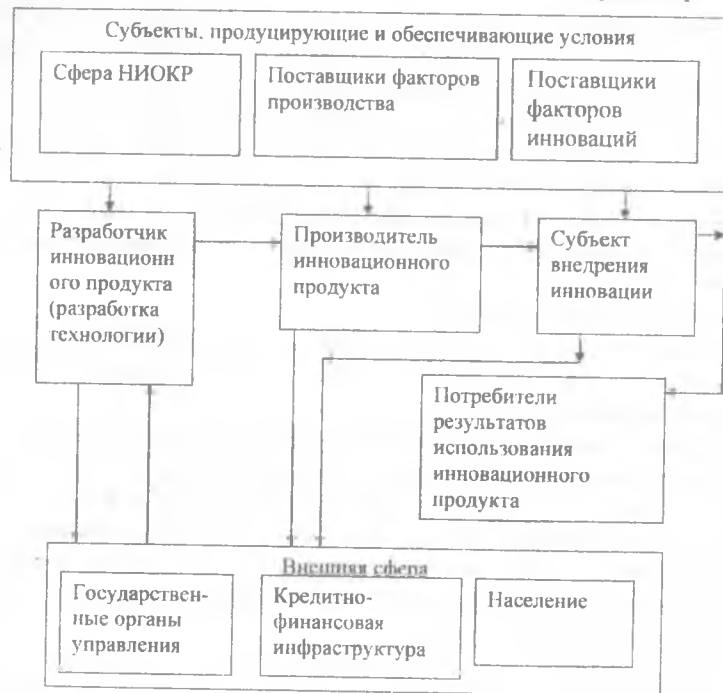
Рис. Структурная схема инновационной системы

7. Субъекты, обеспечивающие необходимые условия — субъекты, обеспечивающие проведение необходимых НИОКР, поставку оборудования, строительство предприятий, подготовка кадров и пр.