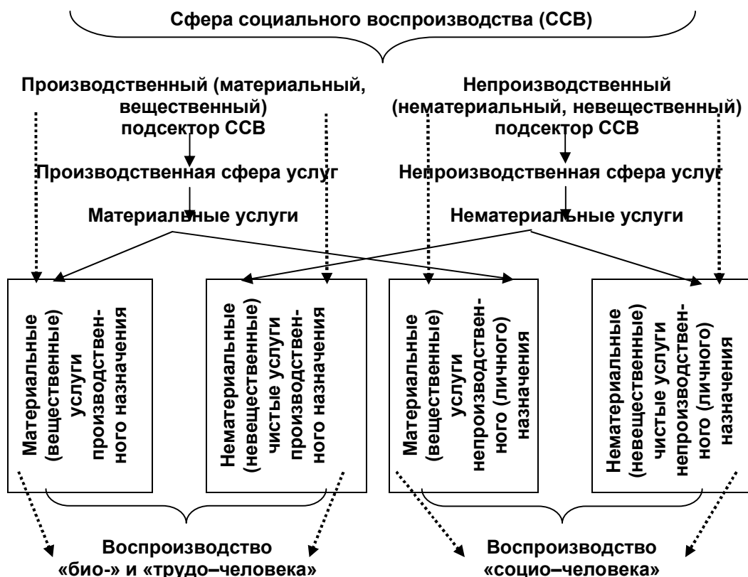
Рис. 3. Взаимосвязь ССВ и сферы услуг с точки зрения воспроизводства «социо-человека»

Исходя из предложенной схемы, воспроизводство «социо-человека» осуществляется в непроизводственном подсекторе ССВ с помощью нематериальных услуг непроизводственной сферы. Однако вполне очевидно, что удовлетворение социально-культурных, духовных, интеллектуальных запросов человека через образование, науку, здравоохранение, спорт, туризм, социальное обеспечение, культуру и искусство возможно не только в нематериальной невещественной форме, а и с помощью материальных услуг, имеющих вещественную оболочку. Именно в этом и состоит проблема взаимоувязки непроизводственного подсектора ССВ со сферой услуг.