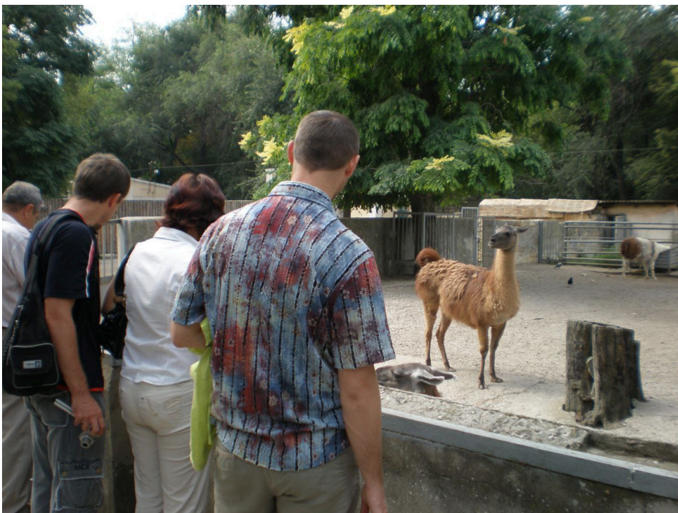
За парканом (не)волі