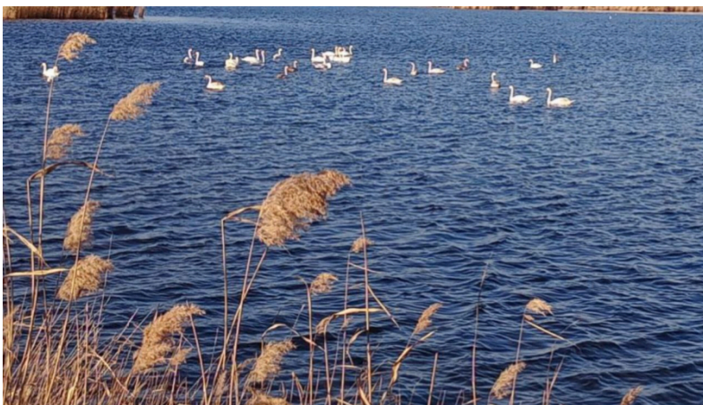
Моногамні мешканці нацпарку