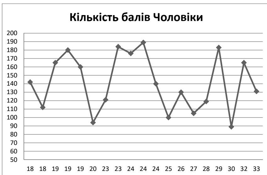
Рис. 1. Розподіл значень залежності за віком (чоловіки)

Якщо порівняти ці значення з рівнем залежності в кожному окремому випадку, то можна зробити висновок, що співвідношення негативних і пози-