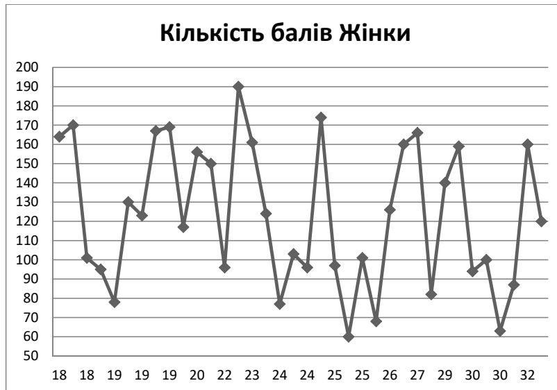
Рис. 2. Розподіл значень залежності за віком (жінки)

тивних тверджень прямо пропорційне рівню залежності (тобто респонденти з високим рівнем залежності від соціальних мереж мають більшу кількість негативних тверджень).