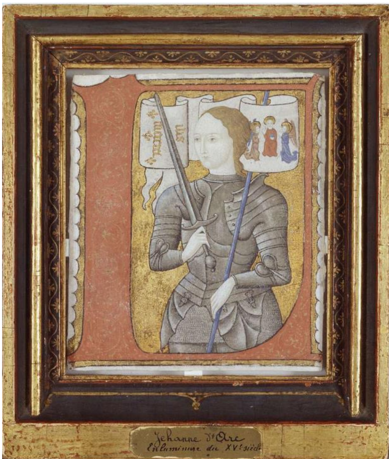
Archives Nationales (France). Reference codes: AE-II-2490 [1]