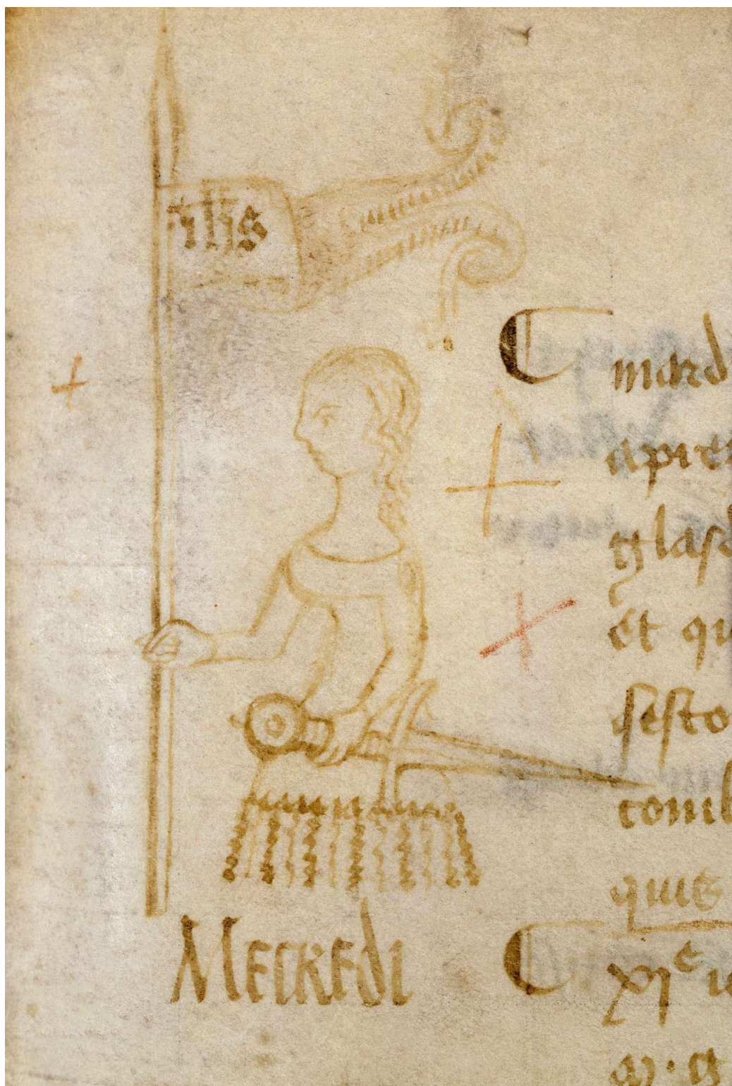
Registre du parlement de Paris. Page 24. Archives Nationales. Reference codes: AE/II/447 [2]