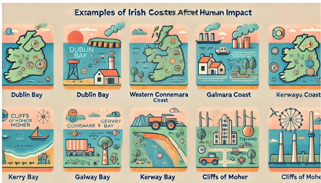
Рис.2.2 Приклади прибережних зон Ірландії, які постраждали від антропогенного впливу.

Далі приведена інфографіка з прикладами прибережних зон Ірландії, які постраждали від антропогенного впливу. Діаграма включає зони Дублінської затоки, західного узбережжя Коннемари, затоки Голвей, берегової лінії Керрі та скель Кліффс оф Могер, з відповідними іконками для забруднення, туризму, ерозії та інших видів впливу.