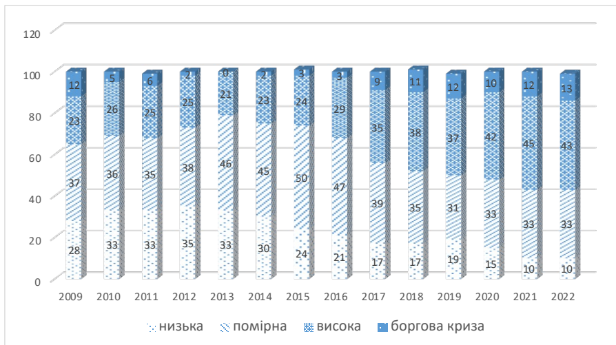
Рис. 2. Відсоткове співвідношення країн з низьким, помірним, високим і кризовим рівнем заборгованості за 2009 – 2022 рр. (%).

туацію, пов'язану із заборгованістю, або ж мають високий ризик появи зазначеної ситуації, збільшилася до 60 %, що вдвічі більше, ніж було зафіксовано у 2015 році (рис. 2)