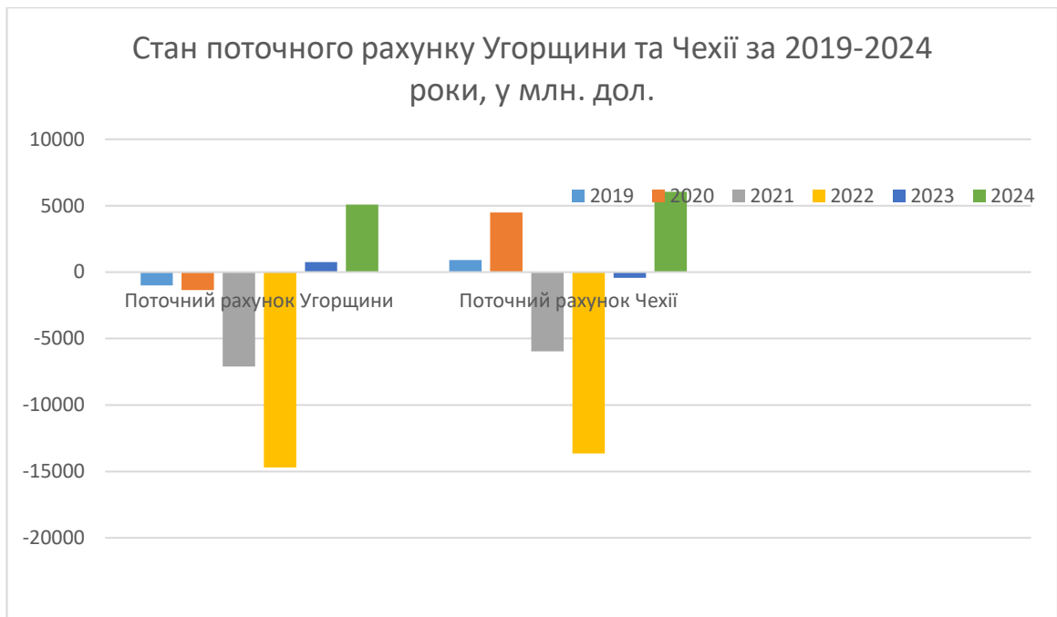
Рис. 2.1 Динаміка балансу поточних Угорщини та Чехії за 2019-2024 роки, у млн. дол.

Джерело: складено на основі даних [25-26].