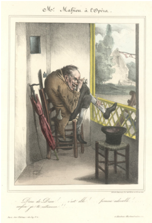
Ил. 1. Месьё Майё в Опере (6 февраля 1830 г.) «Боже, Боже!... это она!... восхитительная женщина!... в конце концов я тебя заполучу!!»