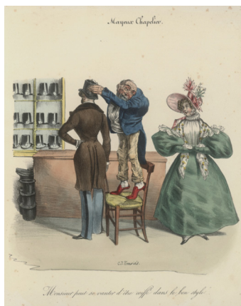
Ил. 9. Прodelки мeсьё Майё (1831 г.) Доктор Майё. Прелестно! Прелестно!