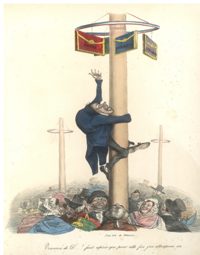
Ил. 12. Приключения мeсьё Майё (1831 г.) типография Шараса. «Гром небесный... надеюсь, что на этот раз я заполучу один...»