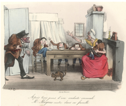
Ил. 5. Полная история месё Майё (1830-1831 гг.) После трёх беспутных дней месё Майё возвращается в свою семью (1831 г.)