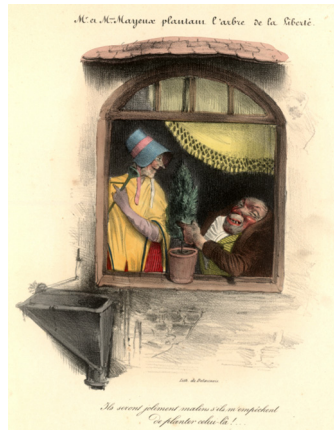
Ил. 4. Полная история месьё Майё (1830-1831 гг.) Месьё и Мадам Майё сажают дерево Свободы... (1831 г.) «Какими негодьями они будут если помешают мне посадить вот это!...»