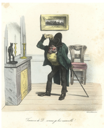
Ил. 7. Полная история месё Майё (1830-1831 гг.) «Гром небесный ... как я на него похож!...» (1831 г.)