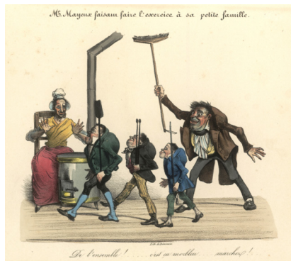
Ил. 6. Полная история месё Майё (1830-1831 гг.) Месё Майё тренирует свою маленькую семью. «Вместе!... Чёрт возьми... маршируйте!» (1831 г.)