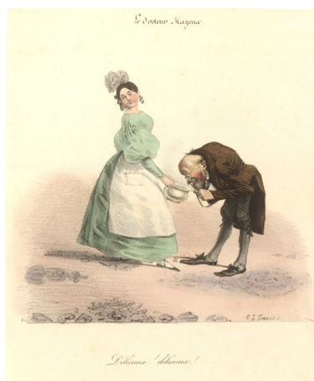
Ил. 8. Прodelки месё Майё (1831 г.) Шляпник Майё. «Месё вы можете тешить себя тем, что ваш головной убор (игра слов: ваши рога) по последней моде»