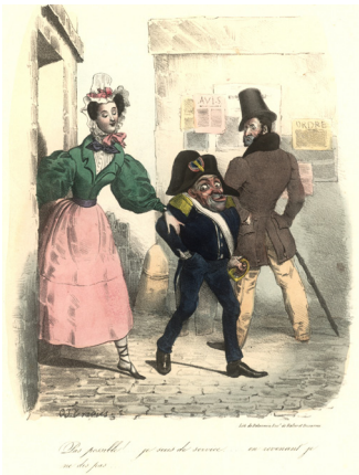
Ил. 3. Полная история месьё Майё (1830-1831 гг.) «Не могу!... Я на службе... а на обратном пути не откажусь» (1831 г.)