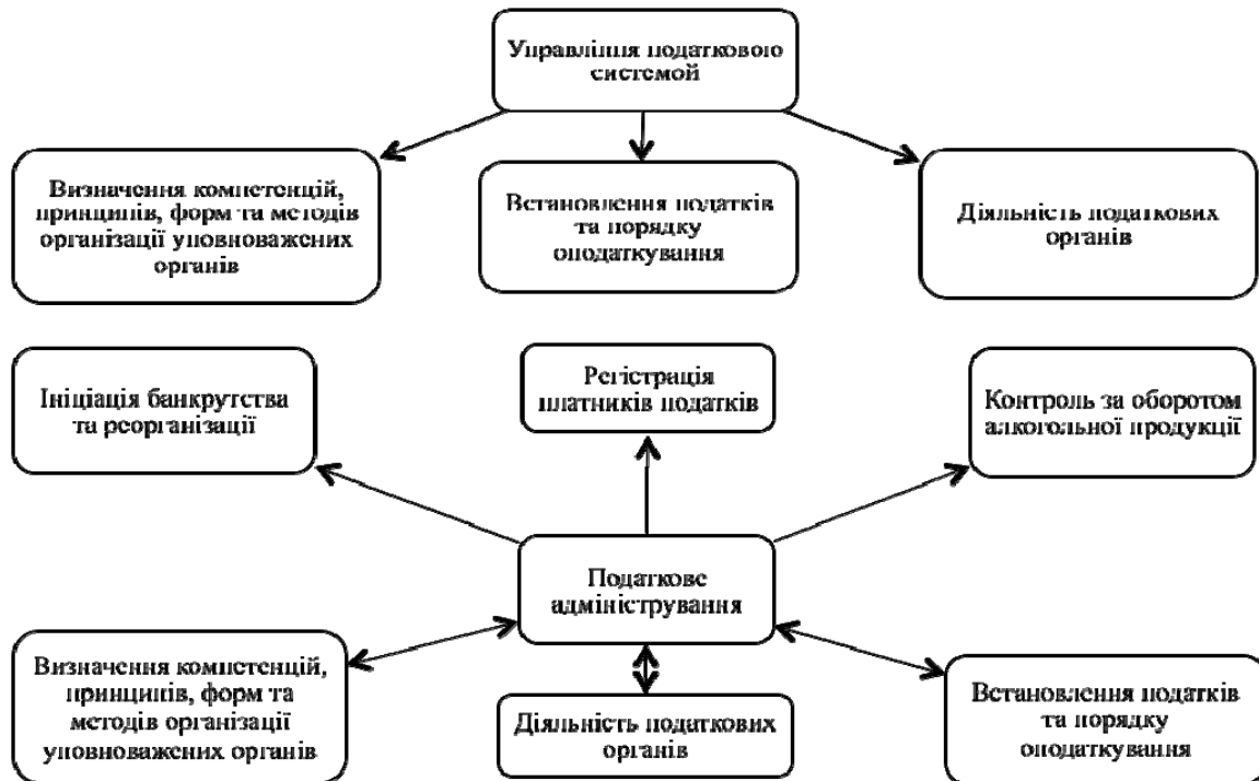
Рис. 1. Механізм управління податковою системою

Основні елементами податкового адміністрування визначені на рис. 2.