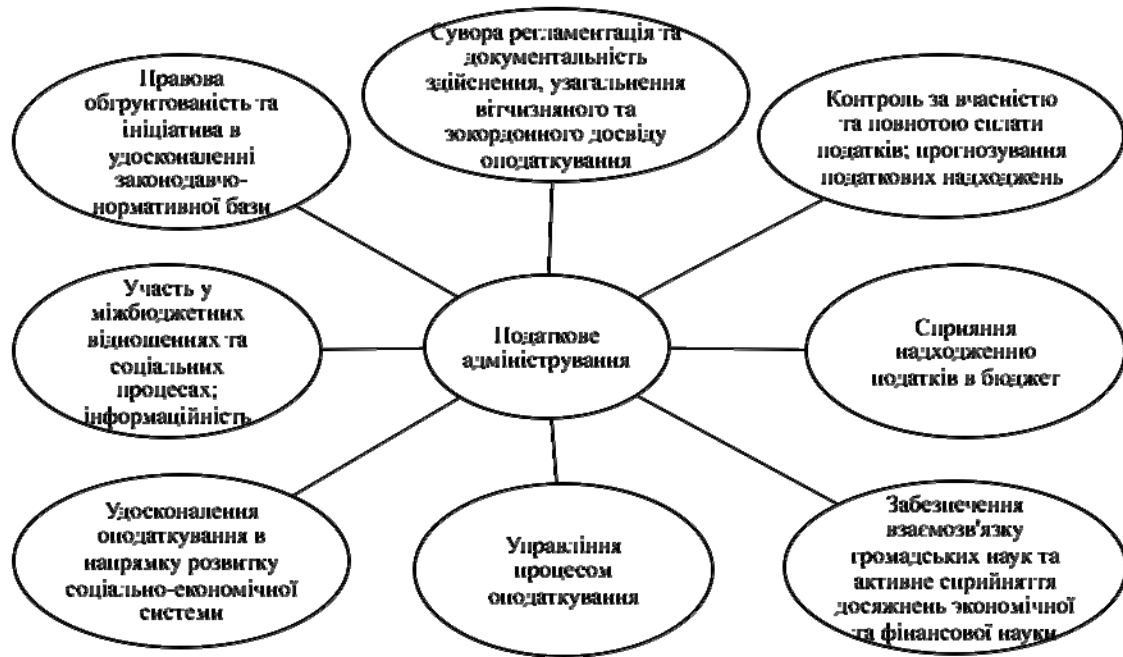
Рис. 3. Система податкового адміністрування

На сучасному етапі податкове адміністрування вимагає вирішення наступних завдань: