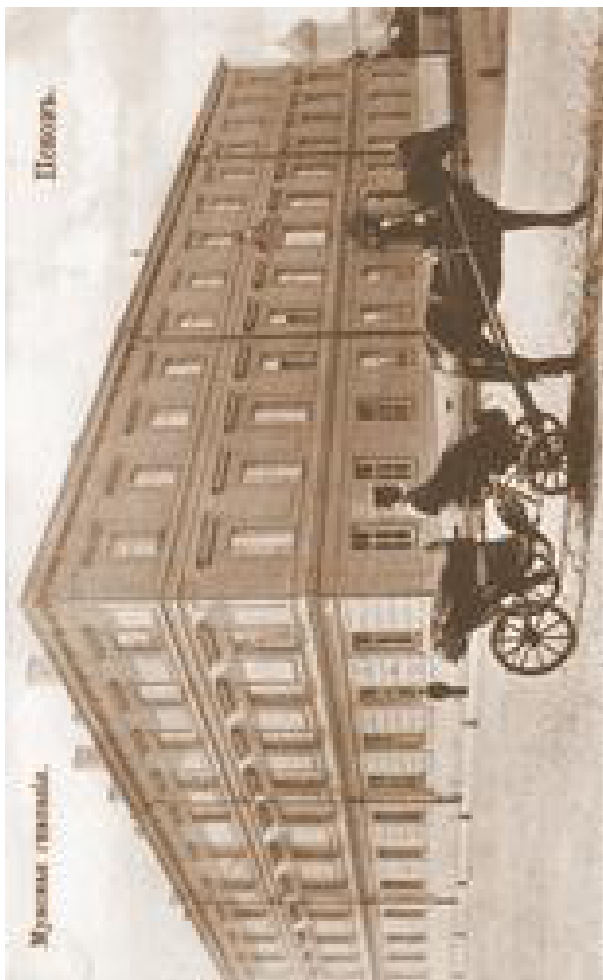
Іл. 7. Псковська губерньська чоловіча гімназія. Фото початку ХХ ст.