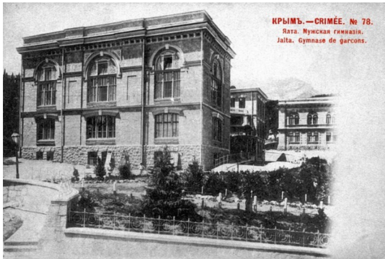
Ил. 4. Чоловіча Олександрівська гімназія