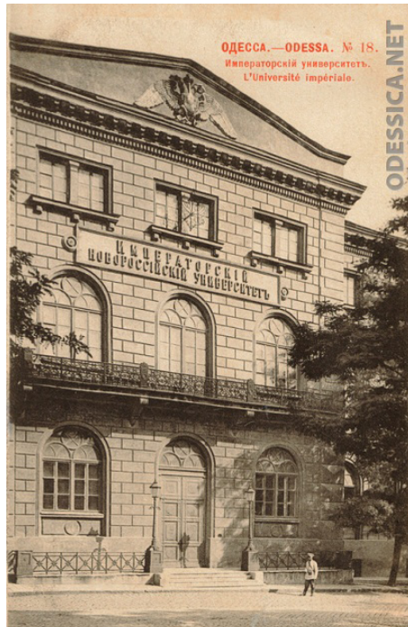
Ил. 3. Императорський університет