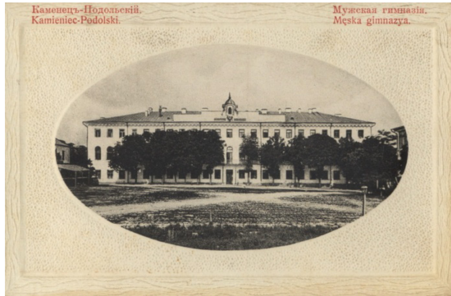
Іл. 1. Кам'янець-Подільська чоловіча гімназія (кін. XIX ст.)