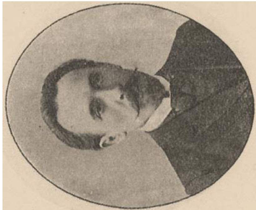
Ил. 5. Артур Генрихович Готлиб, директор Ялтинської гімназії