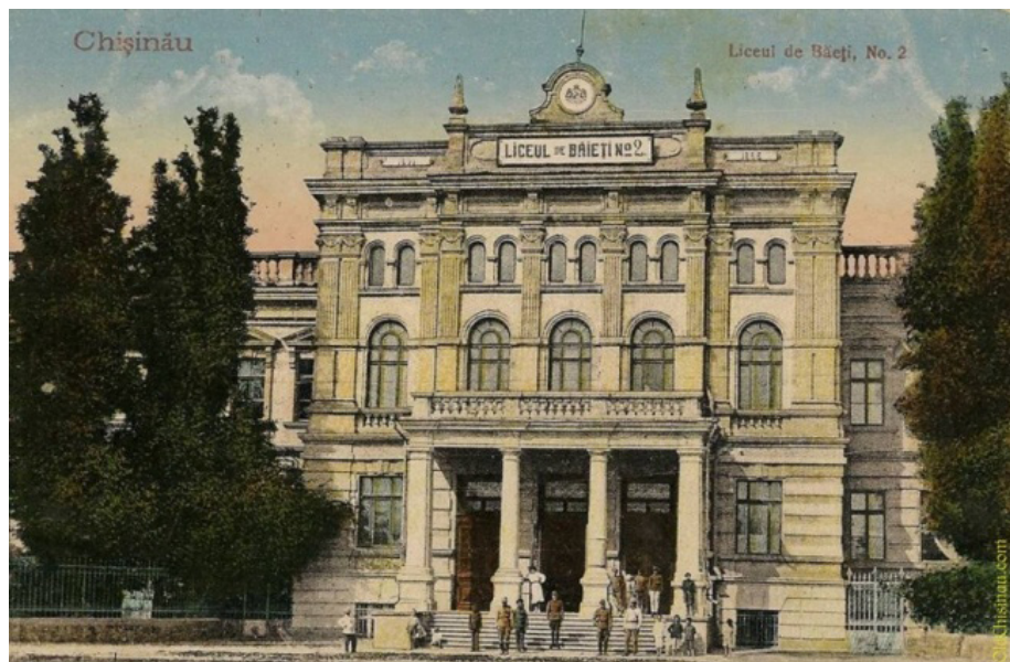
Іл. 2. Кишинівська чоловіча гімназія