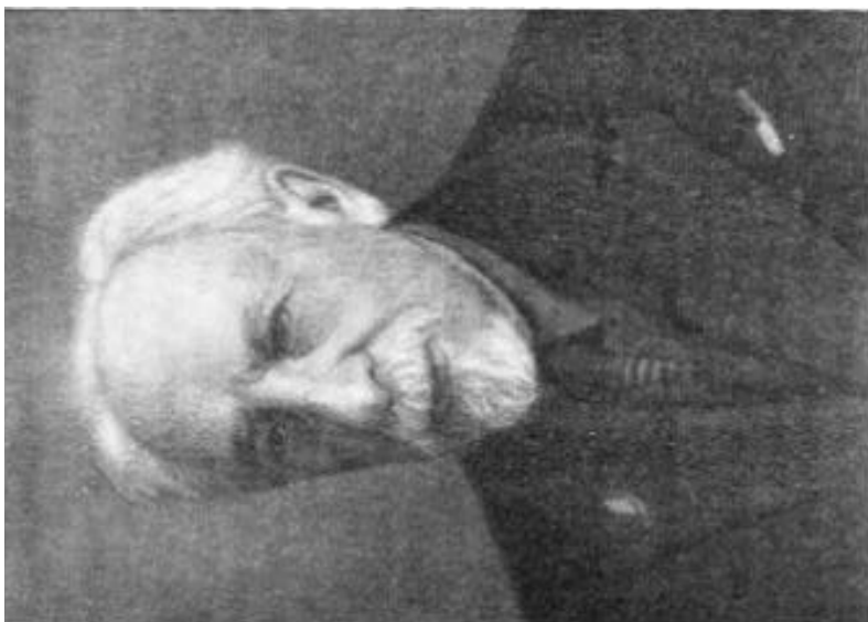
Іл. 12. Артемій Григорович Готалов-Готаліб