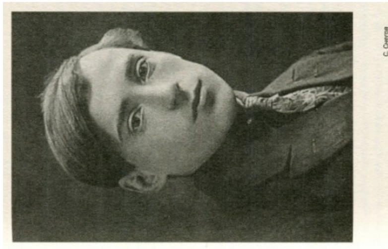
Іл. 9. Сергій Снегов (Сергій Олександрович Козерюк)