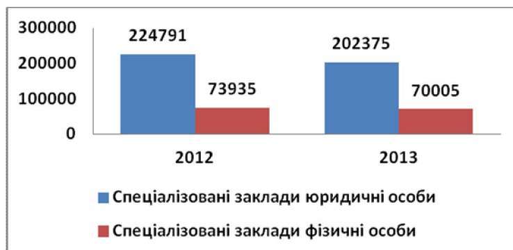
Рис. 1. Динаміка розміщення у спеціалізованих засобах розміщування – юридичних та фізичних особах у 2012-2013 роках, осіб*

У 2013 році до складу санаторно-курортного комплексу Одеської області входило 28 санаторіїв, 10 санаторіїв-профілакторіїв, 9 будинків та пансіонатів відпочинку, 385 баз та інших закладів відпочинку. Можна зробити висновок, що в останні роки кількість санаторно-курортних і оздоровчих закладів в Одеській області має тенденцію до зниження (рис. 1).