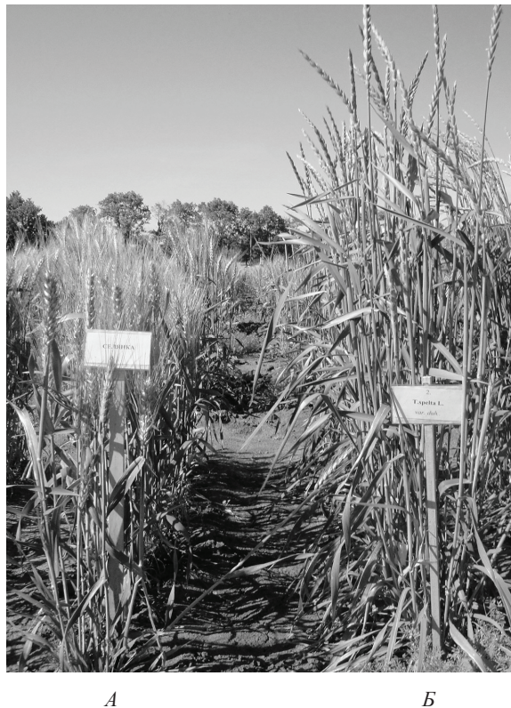
Рис. 1. Рослини озимої пшениці T. aestivum L. (А) та T. spelta L. (Б) у фазі цвітіння

Відмінності біометричних параметрів рослин сортів озимої пшениці T. aestivum L. та пшениці T. spelta L. у фазі цвітіння візуально добре помітні (рис. 1), вони відображені в табл. 1.