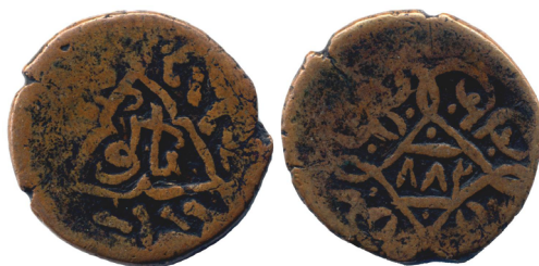
Рис. 1. Медная монета 882 г.х., чекан Баку(йа) (С. Альбум, тип А-Т3184, RRR)

Представляемая монета (см. Рис. 1) была размещена автором в нумизматической он-лайн базе данных восточных монет ЗЕНО [3, #103445]. Монета выполнена из меди на заготовке округлой формы. Метрологические данные монеты – диаметр 20 мм, вес 5,56 г.