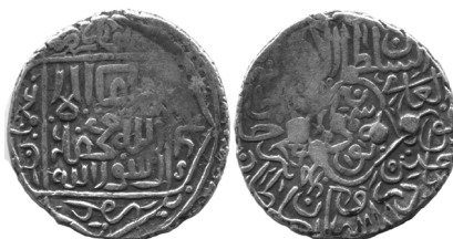
Рис. 2. Султан-Хусайн, Симнан, 896 г.х., серебряная таньга (В= 4,72 г; Д= 24 мм)