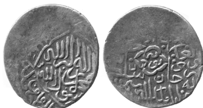
Рис 5. Султан-Хусайн, Симнан, серебряная таньга (В= 4.76 г; Д= 23 мм)

Неполный оттиск штемпеля на монете и потертость от обращения не дают возможности полностью четко восстановить все надписи легенды. Наиболее вероятно, что в левой нижней части монетного поля оборотной стороны, которая не сохранилась на обоих экземплярах, монетная легенда содержала и год выпуска.