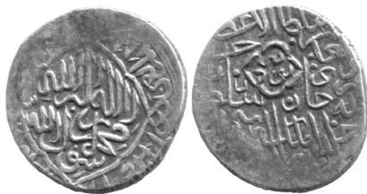
Рис. 4. Султан-Хусайн, Симнан, серебряная таньга (В= 4.78 г; Д= 23 мм)