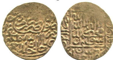
Рис. 1. Кучкунчи-хан, Герат, золото (В= 1,19 г; Д= 14,5 мм). Тип 1 (Новый)

Надписи в фигурных сегментах, содержащие имена халифов, указаны основанием наружу, т.е. надписи выполнены по часовой стрелке. Имя первого халифа Абу Бакра с эпитетом в верхнем сегменте полностью стерто.