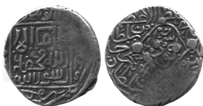
Рис. 3. Султан-Хусайн, Симнан, 896 г.х., серебряная таньга (В= 4,72 г; Д= 21 мм)

Лицевая сторона монеты имеет стандартный вид с упоминанием символа веры и имен четырех правоверных халифов, причем до и после имени Абу Бакра, а так же после имени Али помещен S-образный знак-украшение, повернутый на 90 градусов, вызывающий отдаленные ассоциации с тамгой Чагатаидов. Свободные места в поле, не занятые монетной легендой, заполнены украшениями в виде точек.