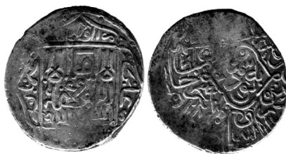
Рис. 1. Султан-Хусайн, Симнан, 896 г.х. (1486–1487 гг.), серебряная таньга (В= 4,78 г; Д= 24 мм)

= ... султан высочайший абу-л-гази Султан-Хусайн бахадур хан да увековечит Аллах (его) власть и правление 697(698)