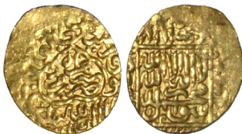
Рис. 2. Кучкунчи-хан, Герат, золото (В= 1,20 г; Д= 14 мм). Тип 1 (новый)

Позднее, уже в ходе завершения этой статьи, в базе восточных монет ZENO.RU была выявлена еще одна монета рассматриваемого периода [8, № 115487], позволившая полностью воссоздать форму центрального картуша и частично подтвердить реконструкцию монетной легенды (Рис. 2).