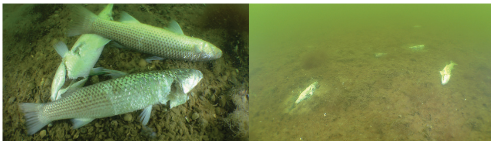
Рис. 3. Погибшие в результате замора особи пиленгаса на исследованных участках дна в Тилигульском лимане 04.03.2014

распределения мертвой рыбы на всем протяжении исследуемых участков дна была практически равномерной и, также как при визуальных наблюдениях в период добычи рыбы из льда 06.02.2014, составляла 3–4 особи на 10 м 2 . При этом в данном районе были зарегистрированы лишь единичные мертвые особи других видов рыб (бычок-зеленчак Zosterisessor ophiocephalus (Pallas, 1814) – 2 экз., морская игла пухлощекая Syngnathus abaster (Risso, 1827) – 2 экз.). Таким образом, по нашим расчетам, на исследованной территории площадью около 2,0 км 2 оказалось сконцентрировано 600–800 тыс. особей погибшего пиленгаса общей массой около 300 т. Учитывая изъятую рыбаками и местными жителями из льда рыбу, можно предположить, что только в данной части лимана погибло не менее 335 т пиленгаса.