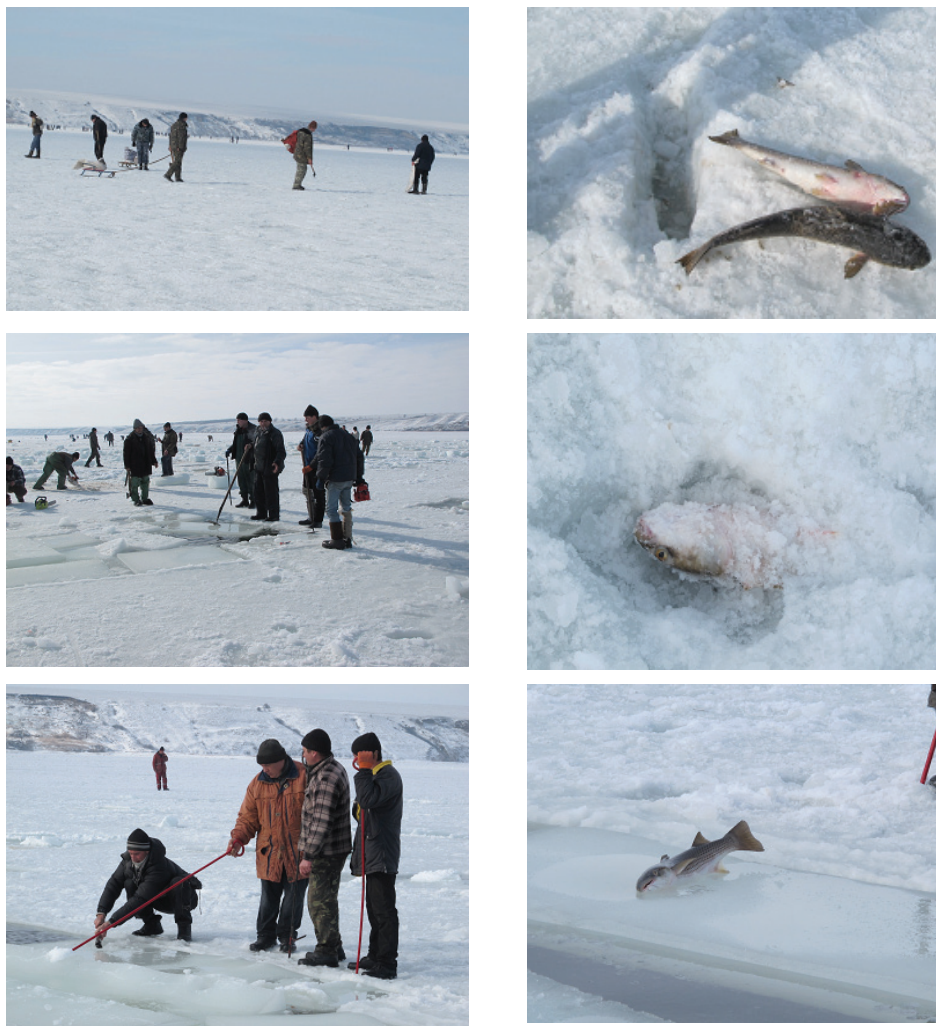
Рис. 2. Добыча тиленгаса на Тилигульском лимане 06.02.2014

По нашим наблюдениям и согласно опросу местных жителей ежедневно с 30.01 по 15.02.2014 вырубкой тиленгаса занималось до 200 человек, которые в течение светового дня добывали в среднем по 10 кг рыбы на 1 человека. По разным оценкам, за 2,5 недели на Тилигульском лимане в районе с. Червоноукраинка было добыто от 35 до 90 т кефали тиленгаса.