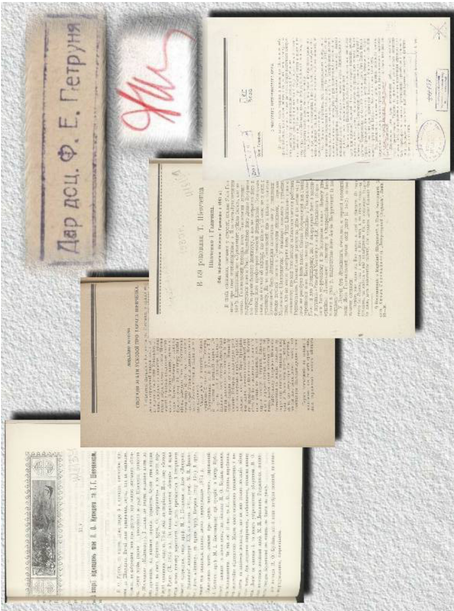
Ил. 4. Страницы оттисков статей из фонда Ф. Е. Петруня. Автограф и дарственный штамп владельца.