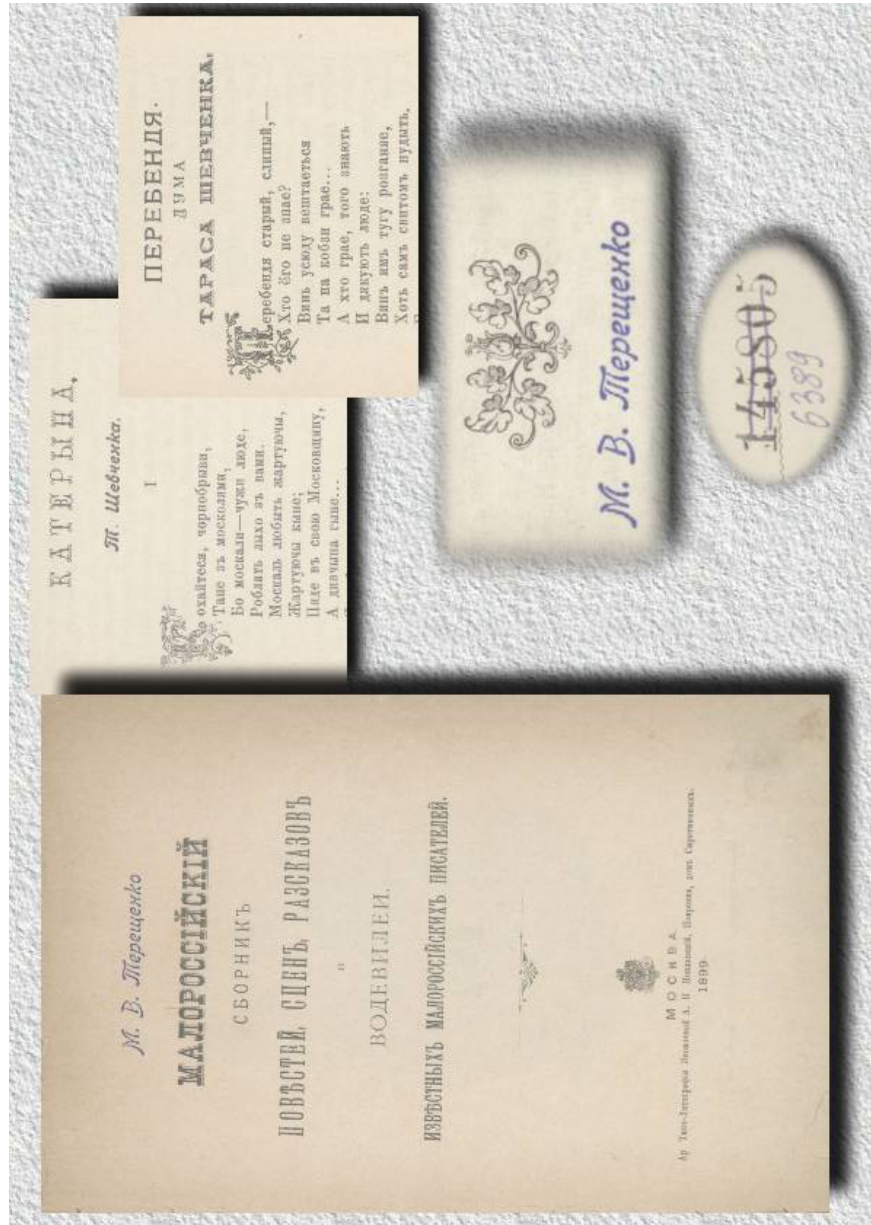
Ил. 1. Титульный лист издания «Малороссийский сборник повестей, сцен, рассказов и водевилей известных малороссийских писателей» (Москва, 1899) с фрагментами произведений Т. Шевченко. Штамп М. В. Терещенко; инвентарный номер.