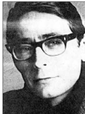
Рис. 6. В.М. Воскобойников (1937 – 1995 гг.)