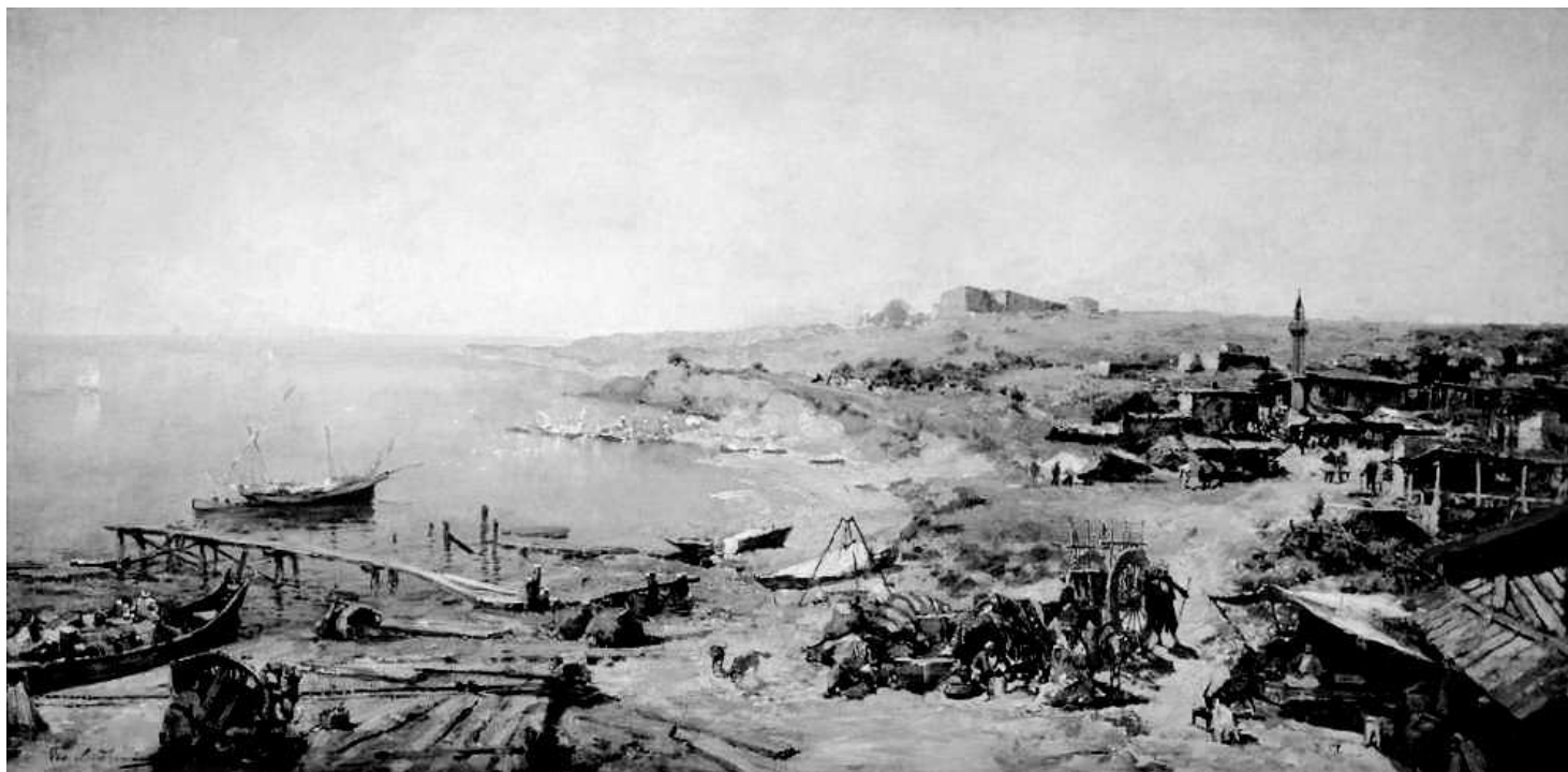
Рис. 2. Натурное изображение древнего турецкого замка (на высоком берегу) и типичного ногайского хутора Хаджибей на месте современной Одессы, предположительно – тогдашнее устье Военной балки. Обращает на себя внимание рыбацкий причал, типичный на Одесском побережье Черного моря.