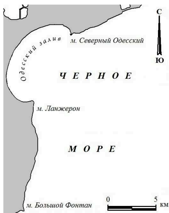
Рис. 1. Схема Одесского побережья между м. Бол. Фонтан и Бол. Аджалыкским лиманом на Черном море в начале XXI века.

Вместе с тем, ряд историков и археологов относят появление Одессы не позже, чем к XIV столетию в виде крупного портового города «Качибей», по всей видимости – украинского. В силу болезненной предвзятости такие авторы во что бы то ни стало хотят, чтобы Одессе было 600 лет [3, 4, 5]. А для этого не брезгают домыслами, догадками, неаккуратным обращением с фактами, тенденциозности, а главное – они не учитывают существенные изменения природных физико-географических условий в течение многих веков. Понятно, что для появления и развития Одессы требовалась достаточно сильная экономическая база: совершенная промышленность, машинное производство, возведение фундаментальных построек и на суше, и на море. Но такие работы были недоступны в XIV веке в условиях причерноморской степи, тем более – «украинцам», а у команов и ногайцев жизненный уклад, традиции и обычаи не способствовали строительству городов, да еще портовых. Построение городов и крепостей в те далекие времена требовало также специальных материалов, длительного времени, – многие десятки лет, как например при постройке Джинестры, Солдаи или Кафы. Судя по апеннинской