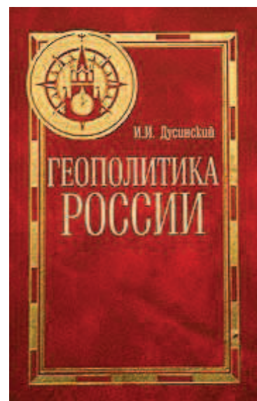
Ил. 4. И. И. Дусинский. Геополитика России. – М., 2003

Некоторые новые сведения из жизни И. И. Дусинского стали известны после публикации в «Одесском мартирологе» аннотированного описания архивно-следственных дел 1919-го и начала 1920-го гг. [19]. В одном из дел значится, что И. И. Ду-