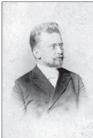
Ил. 2. Петр Евгеньевич Казанский

Живя и работая в Одессе, И. И. Дусинский в 1908-1910 гг. сотрудничал с одесской газетой «Русская речь» 2 , одновременно с этим с 1910 по август 1917 г. заведовал иностранным отделом газеты «Одесский листок» 3 (ил. 3). В прессе он под псевдонимами «Арктур» и «Черномор» поместил ряд острых статей по вопросам международной политики. Часть этих статей была издана отдельным оттиском под названием «Основные вопросы внешней политики России в связи с программой нашей военно-морской политики» (именно эта работа в 2003 г. была переиздана под названием «Геополитика России») [3; 9] (ил. 4).