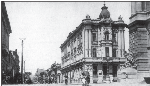
Ил. 3. Редакция газеты «Одесский листок»

Во время Первой мировой войны было широко известно его обращение «К славянам» (1915 г.), в котором И. И. Дусинский говорил о важности панславянской идеи. Некоторые новые сведения из жизни И. И. Дусинского стали известны после публикации в «Одесском мартирологе» аннотированного описания архивно-следственных дел 1919-го и начала 1920-го гг. [19]. В одном из дел значится, что И. И. Дусинский не позднее 3 мая 1919 г., без предъявления ему обвинения, был арестован особым отделом 3-й Украинской Советской Красной армии. Подследственный в показаниях изложил свои политические взгляды и убеждения. По его словам, от общелитературной деятельности он постепенно перешел к чистой публицистике, причем сосредоточился на той ее области, где можно было писать свободно о вопросах внешней и славянской политики России, не становясь рупором какой-то определенной партии. К этому его побудило ощущение надвигающегося перелома в жизни страны – мировой войны. Неизбежность войны И. И. Дусинский как превосходный аналитик и мыслитель ясно ощущал еще с событий Боснийского кризиса 1908 г., понимая вместе с тем, как слабо подготовлена была русская общественность и государственность к разрешению всех связанных с этим вопросов.