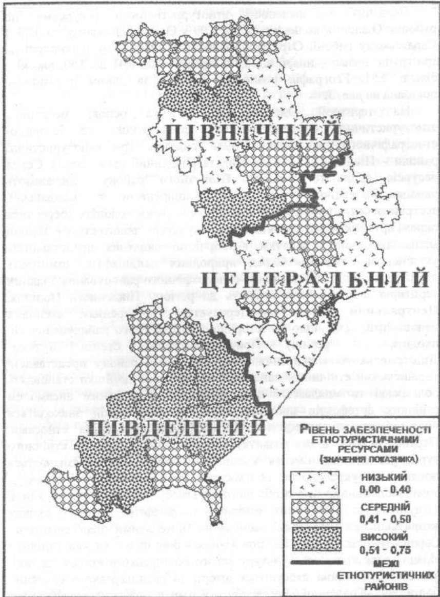
Рис. 3. Розподіл показника забезпеченості етнотуристичними ресурсами по адміністративних районах. Етнотуристичне районування Одещини