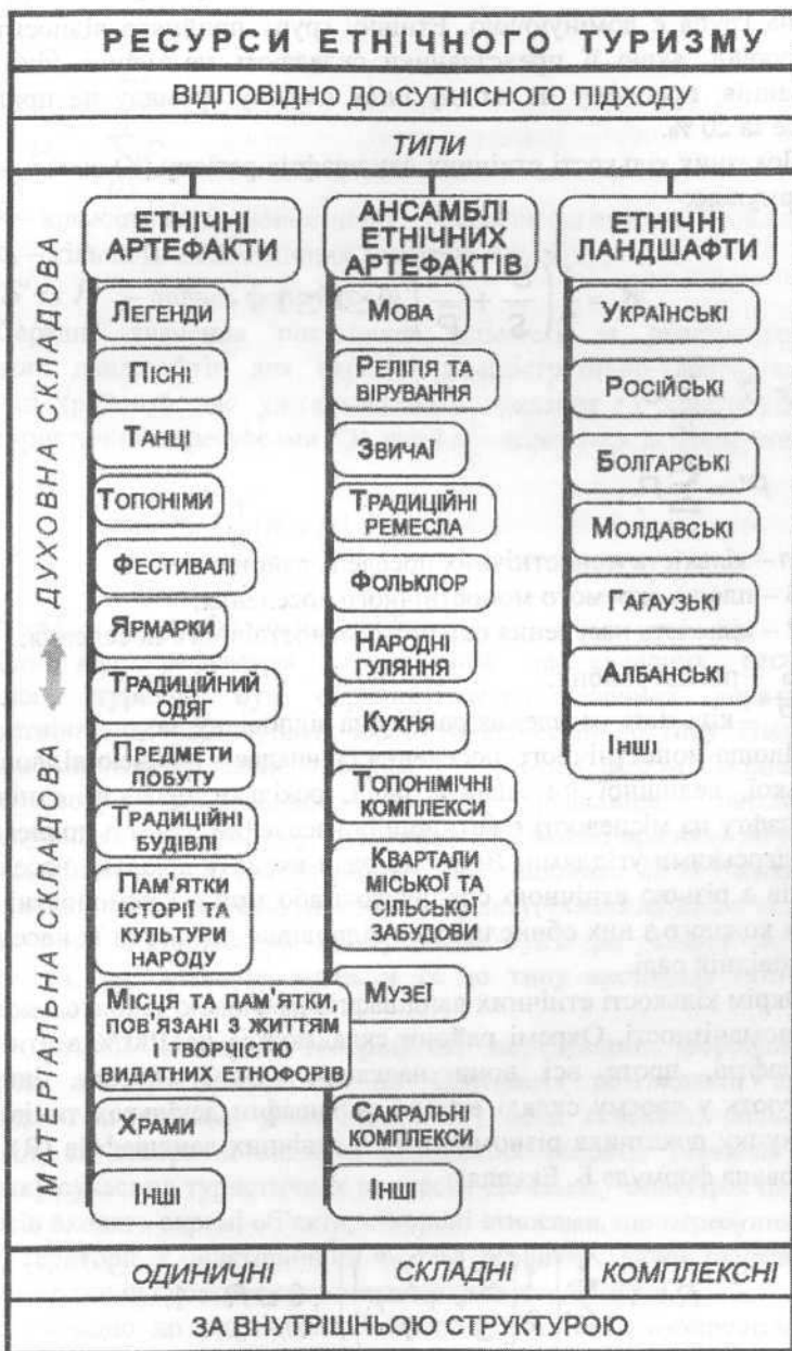
Рис. 2. Ресурси етнічного туризму (сутнісний підхід)