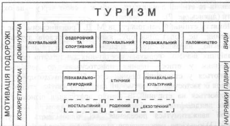
Рис. 1. Логічна схема місця етнічного туризму у класифікації туризму за мотивацією подорожі

Загальноприйнятої дефініції поняття «етнічний туризм» наразі не розроблено. Деякі дослідники пов'язують етнічний туризм з відвідуванням родичів чи місць народження батьків та вважають його лише міжнародним видом. Інші - мають на увазі поїздки з метою етнічного єднання, тобто викликані ностальгічною мотивацією (наприклад, відвідування представниками діаспори своєї історичної батьківщини). У зарубіжній туристичній практиці та науковій літературі під етнічним туризмом найчастіше розуміють міжнародний вид туризму, метою якого є ознайомлення з «екзотичними» етносами, які у повній мірі зберегли традиційні, архаїчні риси матеріальної та духовної культури.